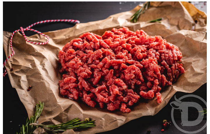
ref. 0069 CARN PICADA DE BUEY DISCARLUX (5kg. x 1u.)