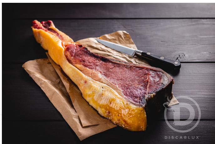
ref. 0051,4 LLOM VACA AMB OS DISCARLUX (15kg. x 2u.)