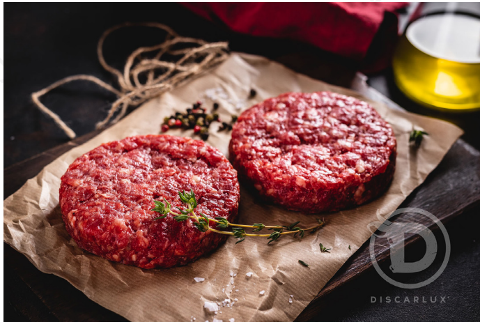
ref. 0080 HAMBURGUESA VACA ARTESANA DISCARLUX (200gr. x 2u. c/2,4kg.)