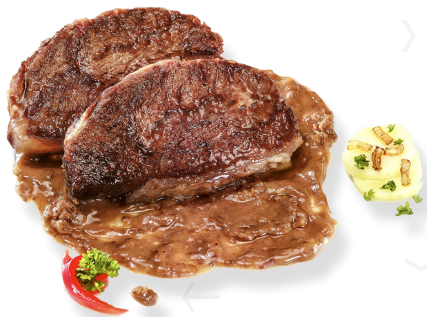
ref. 0450 GALTES DE VEDELLA AMB SALSA CASCAJARES 1,2kg. x 4u.