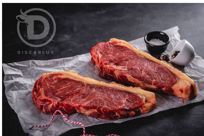
ref. 0052 ENTRECOT VACA LUX DISCARLUX (500gr. x 2u.)