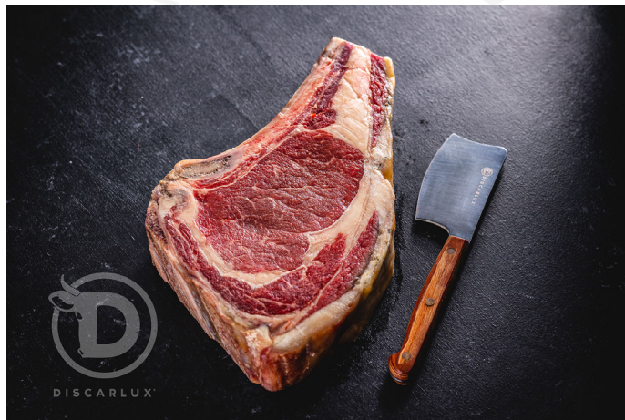
ref. 0035 "CHULETERO CABECERO" VACA DISCARLUX (16kg. x 1u.)