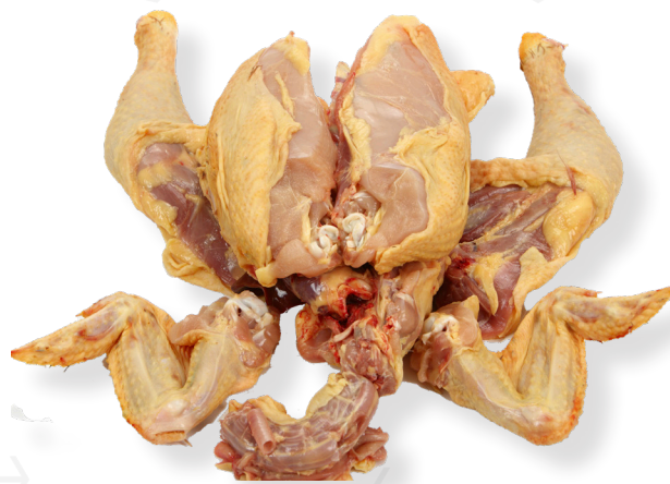
ref. 2988,3 POLLASTRE DE PAGÈS TROSSEJAT GRANJA LUISIANA 3,5kg. x 1u.