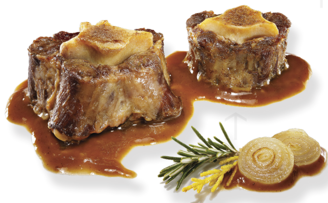
ref. 0813 CUA DE BOU AMB EL SEU SUC CASCAJARES (bossa de 1kg.x 4u.)