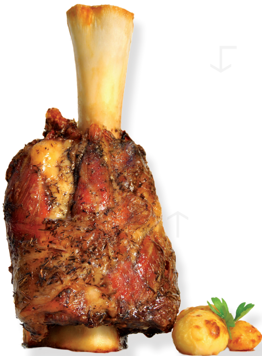
ref. 0432 JARRET DE VEDELLA DE LLET CASCAJARES 1,7kg. + 250gr. DE SALSA