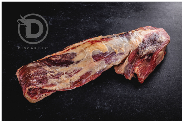
ref. 0064 FILET DE VACA DISCARLUX (+2kg. x 1u.)