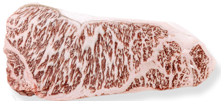
ref. 0084,2 WAGYU WESTHOLME (3kg. x 1u.)