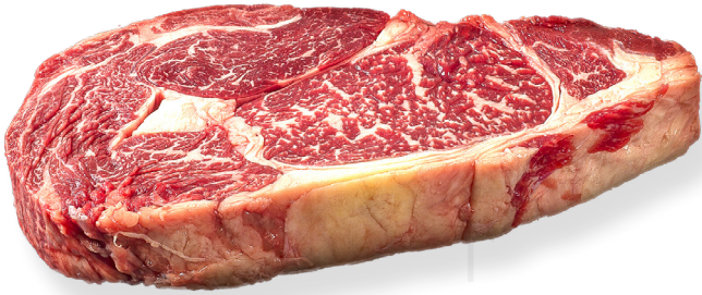
ref. 0004,6 LLOM ALT GRAS +3,5kg.