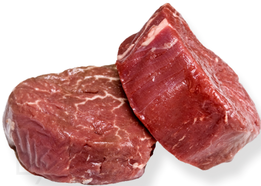
ref. 0009 FILET DE VEDELLA +2,7kg.