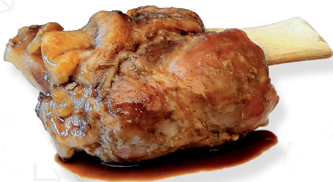
ref. 0432 1/2 BRAÓ DE PORC CASCAJARES ± 350gr. (4 bosses de 2 u.)