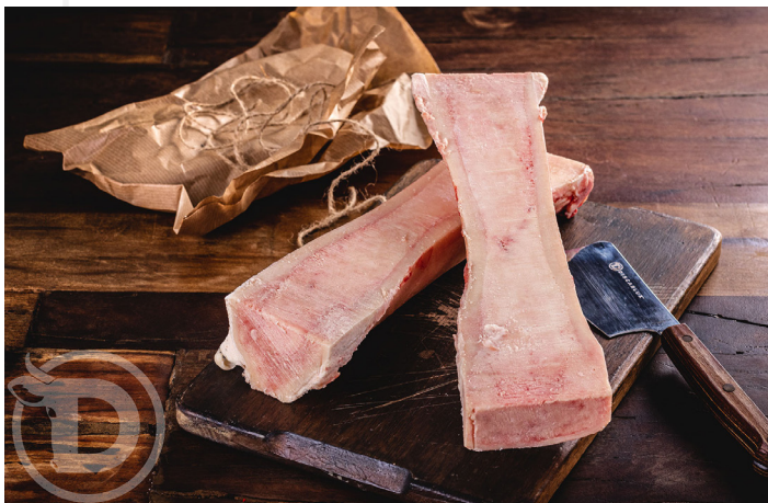
ref. 0078 OS DE LA CANYA (OBERT, 12cm.) DISCARLUX (3,5kg. x 1u.)