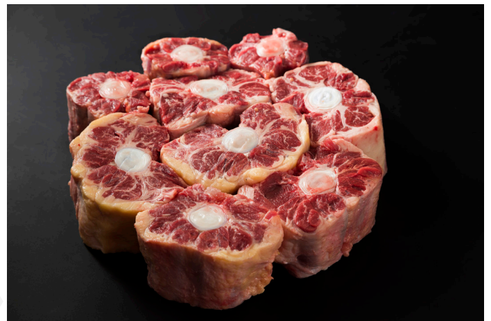
ref. 0073,2 "RABO" DE VACA DISCARLUX (2,5kg. x 2u.)