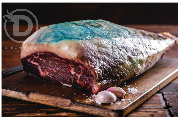
ref. 0075 PICAÑA MADURADA (1SELLO) DISCARLUX (3,5kg. x 1u.)