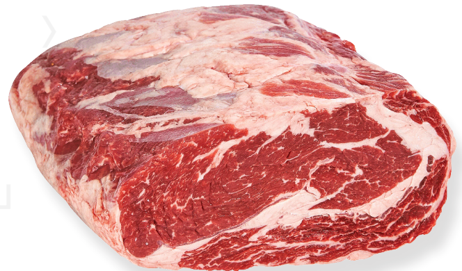
ref. 0007,8 BLACK ANGUS CUBE ROLL NEBRASKA 4KG.