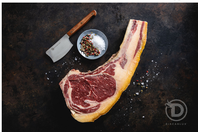
ref. 0050 "CHULETON" VACA LUX DISCARLUX (1kg. x 1u.)