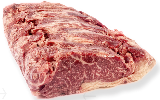
ref. 0005,6 LLOM BAIX GRAS +6KG.