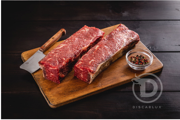
ref. 0053 TATAKI VACA (LLOM BAIX) DISCARLUX (600gr.)