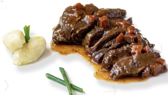
ref. *0448 TALLS DE GALTA DE VEDELLA AMB SALSA AL VI CASCAJARES (bossa de 1kg. x 4u.)