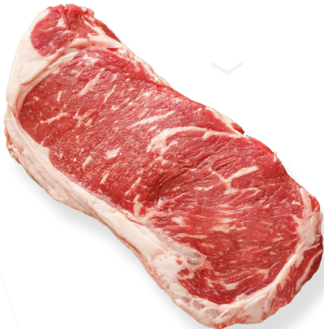
ref. 0023 LLOM ALT DE VEDELLA ARGENTI 2,5KG.