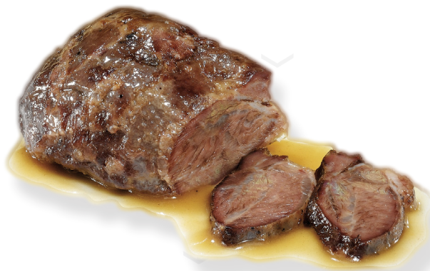
ref. *0449 TALLS DE GALTA DE PORC AMB SALSA OPORTO CASCAJARES (bossa de 225gr. x 10u.)