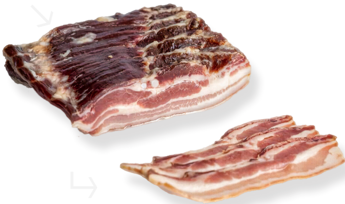
ref.2278 BACON NATURAL 1/2 CASA NOGUERA (1,5kg. x 6u.)