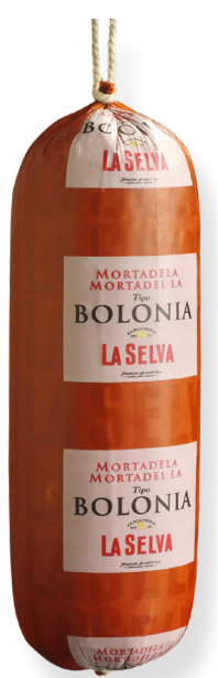
ref.2230 MORTADEL-LA BOLONIA LA SELVA (3,5kg. x 1u.)