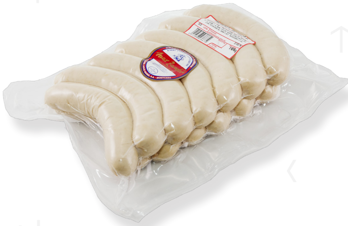
ref.2726 BRATWURST (13u.) MAX ZANDER (1,5kg. x 3u.)