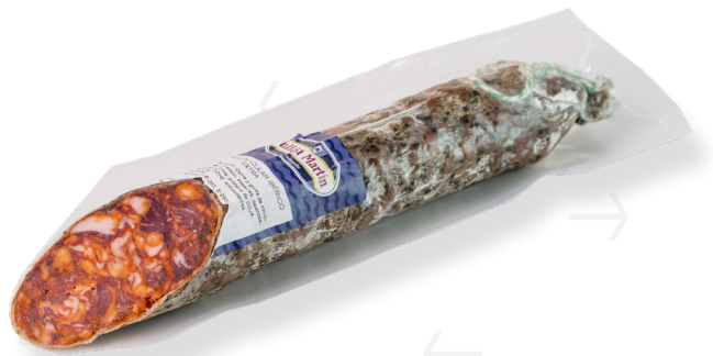
ref.2418,5 XORIÇ IBÈRIC CULAR JULIAN MARTIN(600gr. x 10u.)