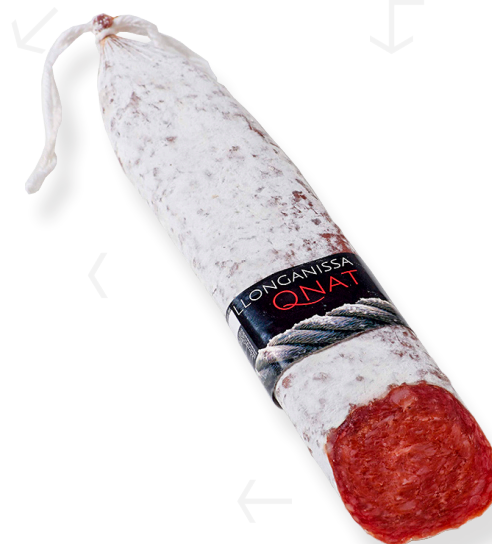
ref.2365 LLONGANISSA PAGES QNAT (500gr. x 4u.)