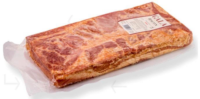
ref.2297 BACON MOTLLE S/COTNA I TENDRUM LA SELVA (3,5kg. x 2u.)