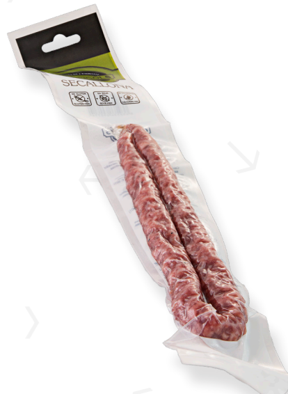
ref.2367 SECALLONA PRIMA FIGOLS (110gr. x 20u.)