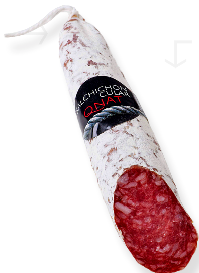
ref.2330 SALSITXÓ CULAR QNAT (1,5kg. x 2u.)