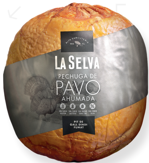
ref.2049 PIT DE DALL DINDI FUMAT LA SELVA (3,5kg. x 1u.)