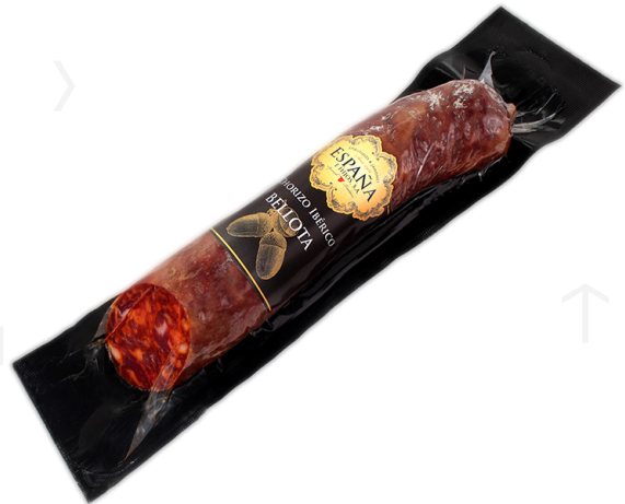
ref.2422,4 XORIÇ IBÈRIC CULAR ESPAÑA(600gr. x 8u.)