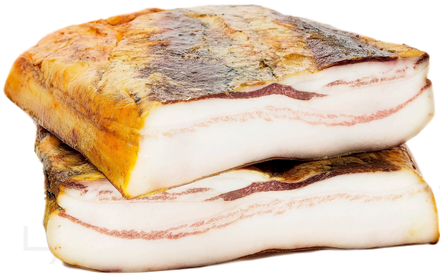
ref.2282 VENTRESCA FUMADA IBÈRICA DE GLÀ CASALBA (2,5kg. x 4u.)