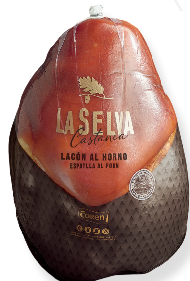
ref.2059,2 ESPATLLA AL FORN CASTANEA LA SELVA (4,75kg. x 1u.)