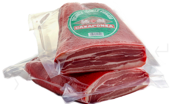
ref.2288 VENTRESCA DOBLE 1/2 PEÇA CASAPONSA (1kg. x 4u.)