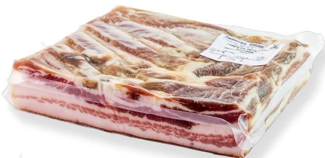
ref.2292 BACON CURAT TEROL DAUDEN (1,2kg. x 4u.)