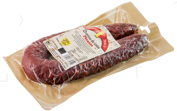
ref.2425 XORIÇ DE LEON PICANT CECINAS PABLO (500gr. x 16u.)