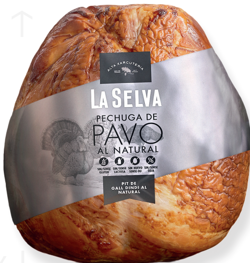
ref.2049 PIT DE DALL DINDI NATURAL BRASEJAT LA SELVA (3kg. x 1u.)