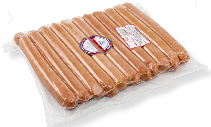
ref.2716 FRANKFURT 21CM MAX ZANDER (1,1kg. x 5u.)