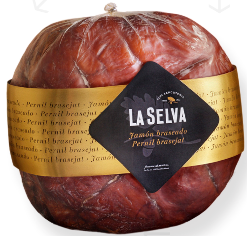
ref.2010 PERNIL COUIT EXTRA BASEJAT LA SELVA (7kg. x 1u.)