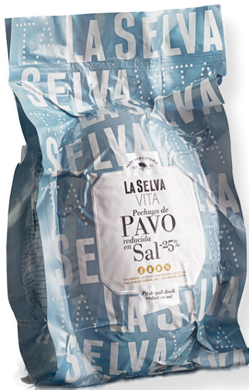
ref.2057 PIT DE DALL DINDI REDUIT AMB SAL LA SELVA (3,1kg. x 1u.)