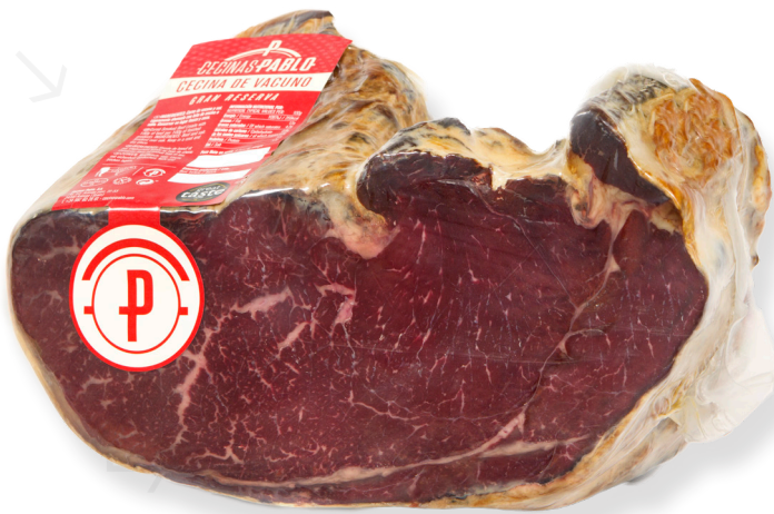
ref.2191 CECINA 1/2 PEÇA PABLO (7kg. x 2u.)