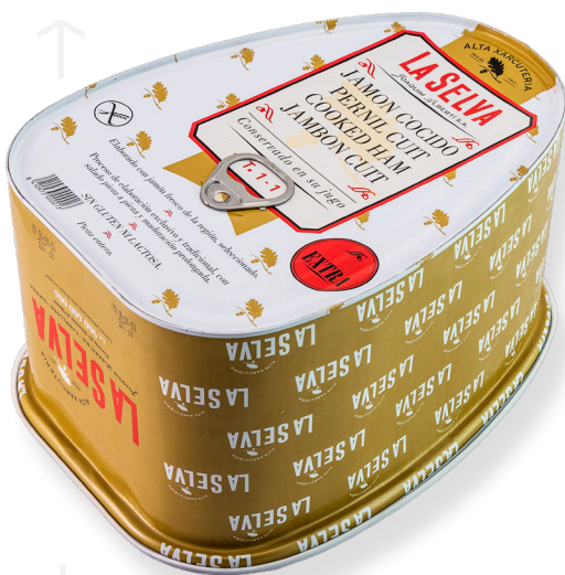
ref.2016 PERNIL COUIT EXTRA LLAUNA LA SELVA (8kg. x 2u.)