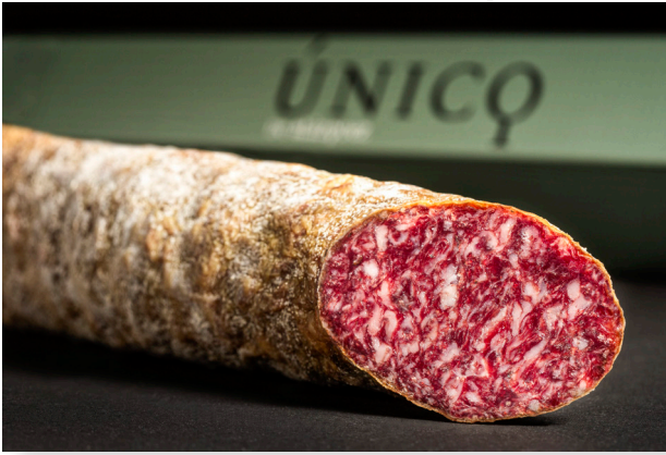
ref.2309 SALSITXO IBÈRIC DE GLÀ ÚNIC BLAZQUEZ(1,2kg. x 3u.)