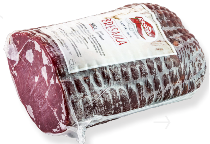
ref.2193 BREASOLA SOTTOFESA FIORUCCI (2,5kg. x 2u.)