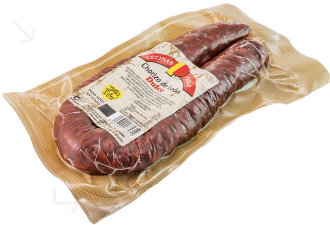
ref.2424 XORIÇ DE LEON DOLÇ CECINAS PABLO (500gr. x 16u.)