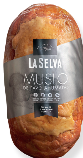
ref.2055 CUIXA DE G ALL DINDI LA SELVA (2,2kg. x 1u.)