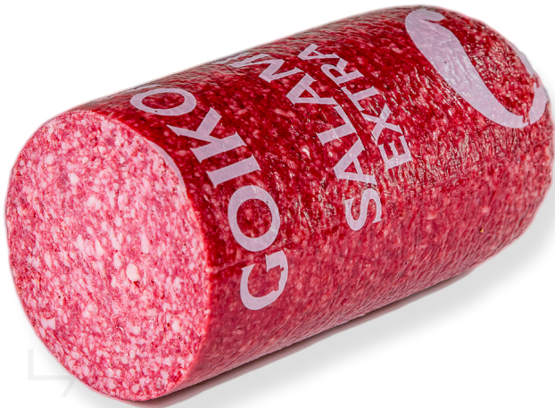
ref.2396 SALAMI EXTRA GOIKOA (4kg. x 1u.)