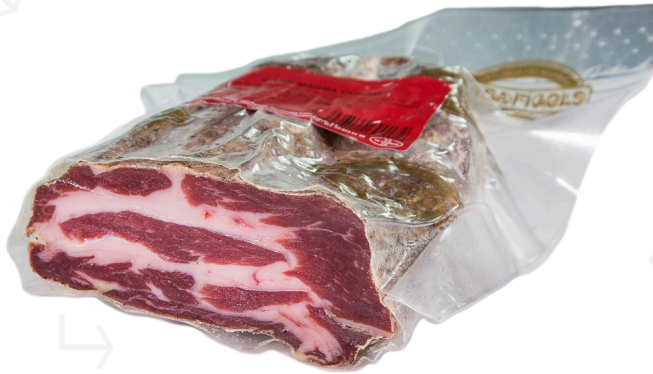
ref.2518 CAP DE LLOM 1/2 PEÇA CASA FIGOLS (300gr. x 8u.)