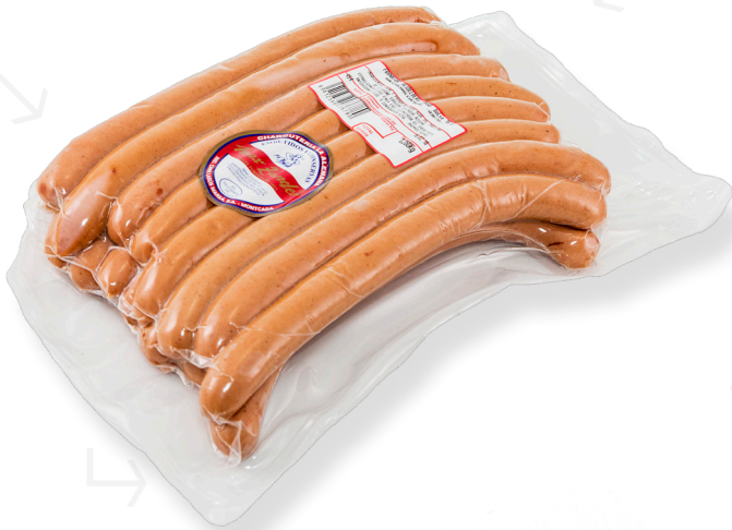
ref.2715 FRANKFURT HEIDELBERG LLARG MAX ZANDER (1,2kg. x 5u.)