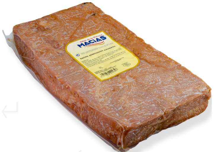
ref.2291 BACON MOTLLE HORECA (4kg. x 2u.)