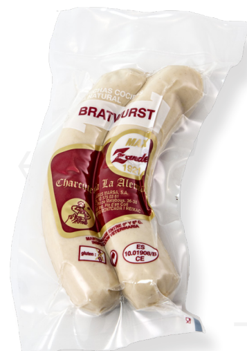
ref.2726 BRATWURST (2u.) MAX ZANDER (200gr. x 25u.)