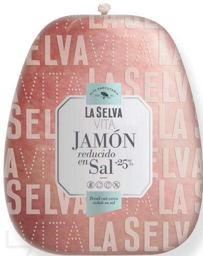
ref.2012 PERNIL COUIT EXTRA VITA(25%- SAL) LA SELVA (6,8kg. x 1u.)