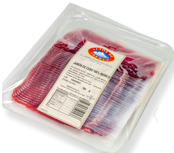
ref.2194,6 LLESQUES DE IBÈRIC DE "CEBO" MONTENEVADO (500gr. x 10u.)