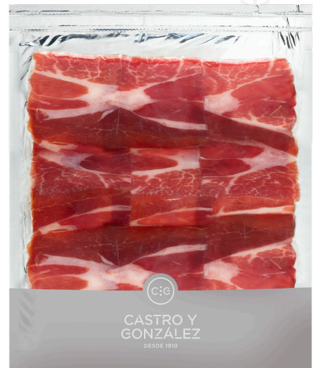
ref.2136 PERNIL IBÈRIC SELECCIÓ CASTRO Y GONZALEZ (50gr. x 20u.)