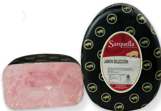
ref.2045 PERNIL CUIT SELECCIÓ SARQUELLA (7kg. x 1u.)