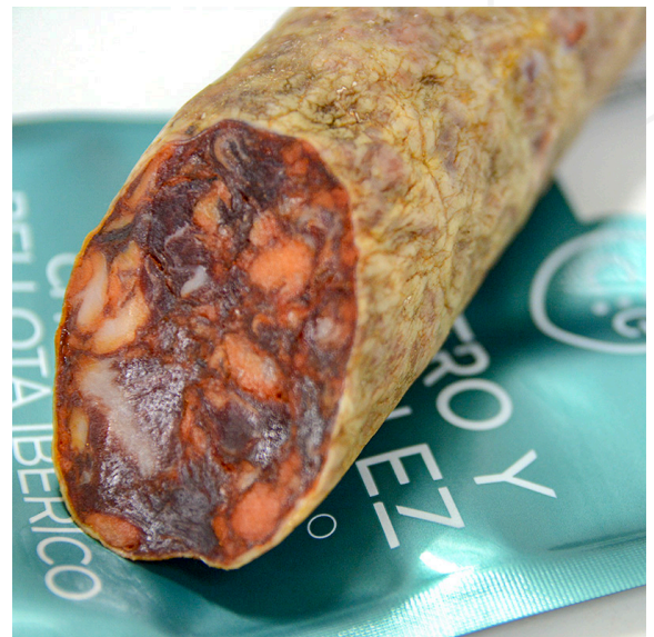
ref.2318 XORIÇ IBÈRIC DE GLÀ CASTRO & GONZALEZ (1kg. x 6u.)