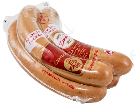
ref.2720 FRANKFURT (4u.) MAX ZANDER (300gr. x 17u.)