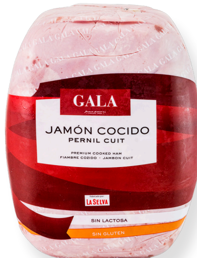
ref.2040 PERNIL CUIT EXTRA GALA LA SELVA (6,5kg. x 1u.)