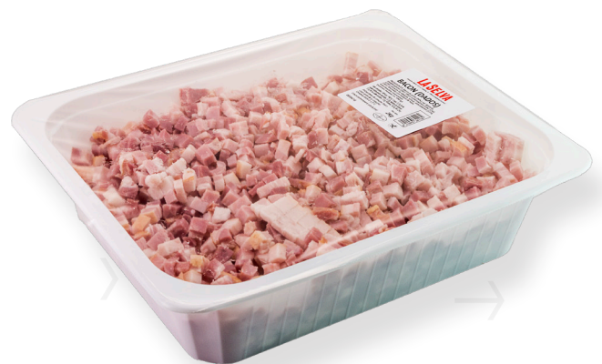
ref.2292,5 DAUS DE BACON S/COTNA- TENDRUM GALA LA SELVA (2kg. x 2u.)