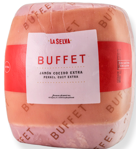
ref.2030 PERNIL CUIT EXTRA BUFFET LA SELVA (7kg. x 1u.)