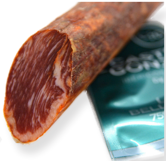
ref.2503 LLOM IBERIC DE GLÀ CASTRO&GONZALEZ (1kg. x 6u.)