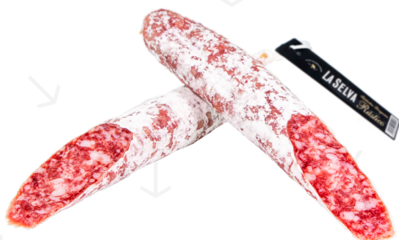
ref.2386 SOMALLA EXTRA 60CM. LA SELVA (0,5kg. x 2u.)