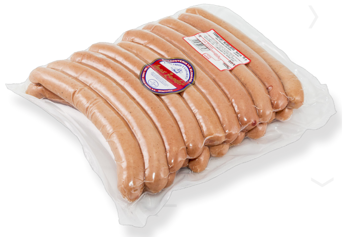
ref.2714 FRANKFURT HEIDELBERG MAX ZANDER (1,5kg. x 8u.)