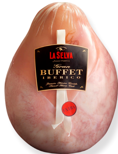
ref.2014 PERNIL COUIT EXTRA GRAN BUFFET IBÈRIC LA SELVA (7kg. x 1u.)