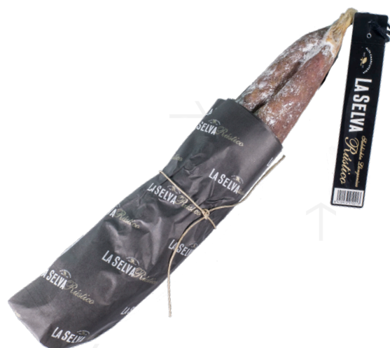
ref.2364 LLONGANISSA RUSTICA LA SELVA (0,65kg. x 2u.)