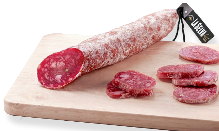
ref.2389 FUET EXTRA LA SELVA (175gr. x 16u.)