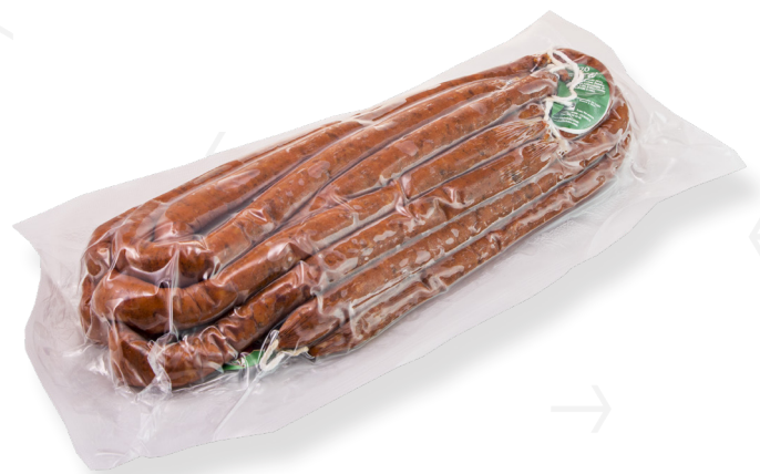
ref.2443 XISTORRA DOLÇA HNOS. BRICIO (2kg. x 3u.)