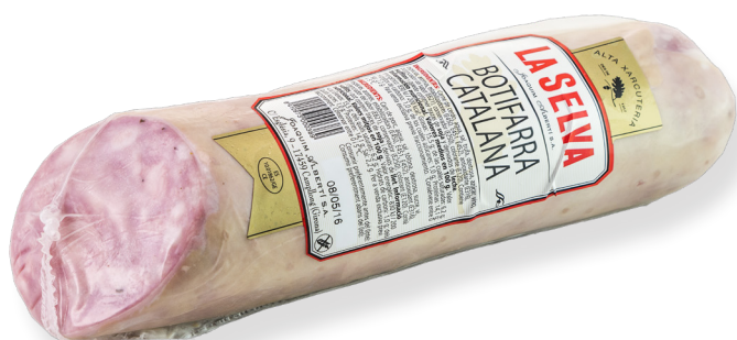
ref.2214 BOTIFARRA CATALANA 1/2 PEÇA LA SELVA (0,6kg. x 1u.)