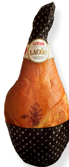
ref.2059 LACÓN FUMAT LA SELVA (6kg. x 1u.)