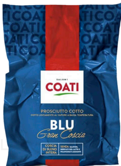
ref.2037 PROSCIUTTO COTTO DELLO CHEF 1/2 FIORUCCI (3,5kg. x 4u.)