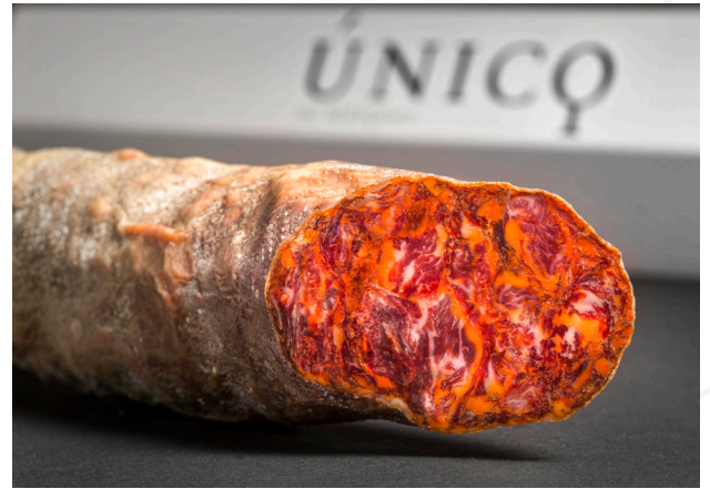
ref.2316 XORIÇ IBÈRIC DE GLÀ ÚNIC BLAZQUEZ(1kg. x 3u.)