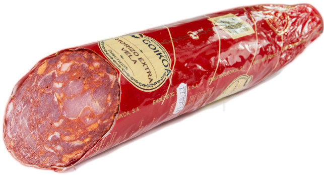
ref.2436 XORIÇ EXTRA "VELA" DOLÇ GOIKOA (1,75kg. x 2u.)