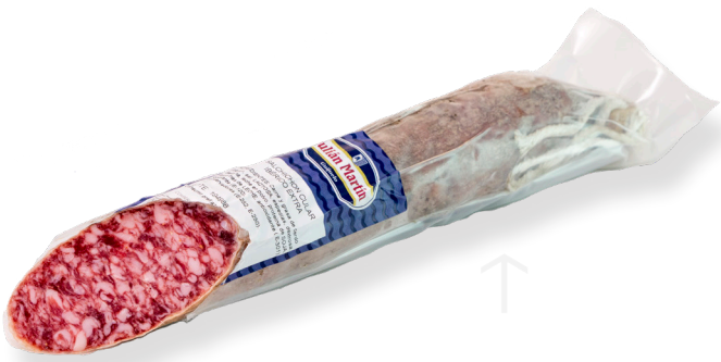
ref.2314 SALSITXO IBÈRIC CULAR JULIAN MARTIN(600gr. x 10u.)