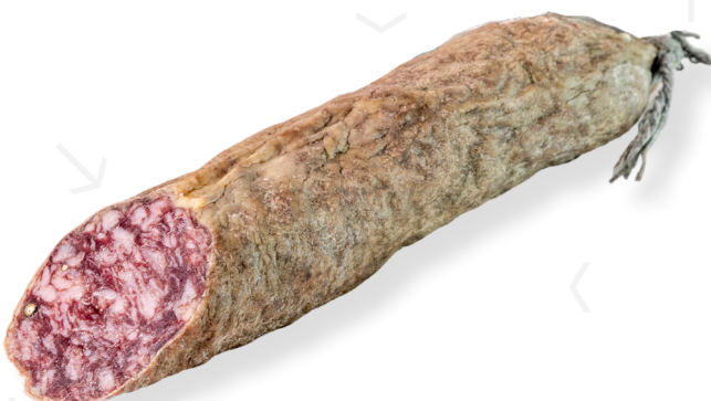
ref.2313 SALSITXO IBÈRIC DE CAMPANYA SELECCIÓ LEONCIO (1kg. x 6u.)