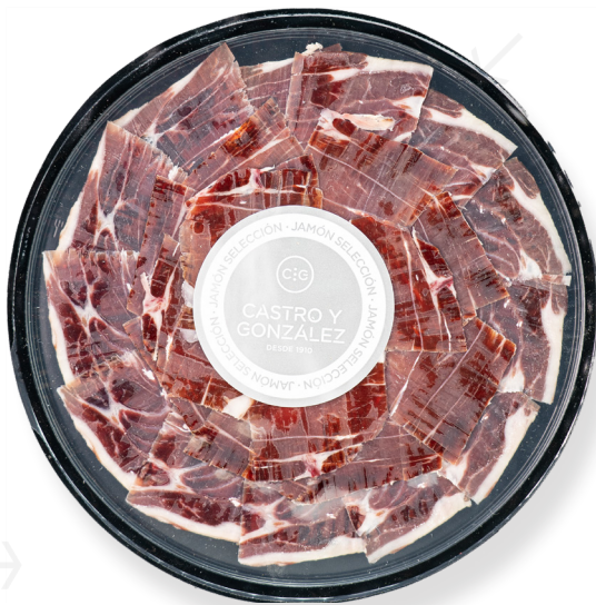
ref.2135,7 PERNIL IBÈRIC SELECCIÓ (TALLAT A MÀ) CASTRO&GONZALEZ (100gr. x 20u.)