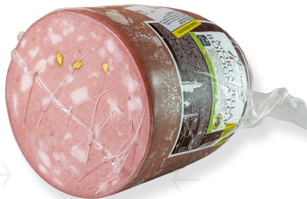
ref.2227 MORTADEL-LA BOLONIA I.G.P. FIORUCCI (5kg. x 1u.)