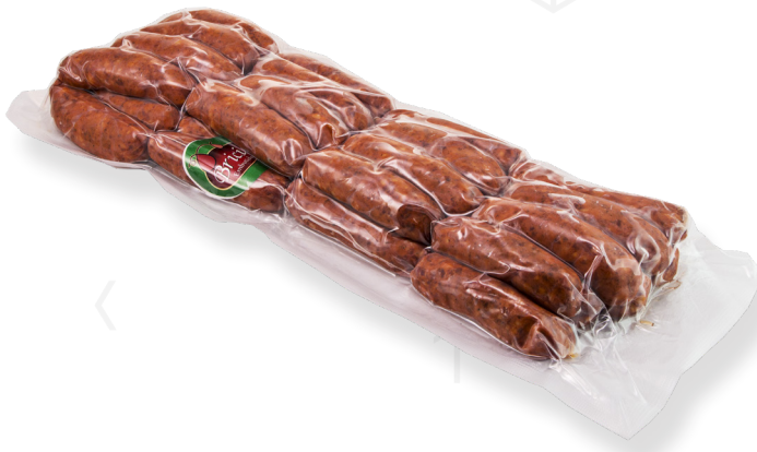
ref.2444 XORIÇ FRESC DOLÇ HNOS. BRICIO (2kg. x 3u.)