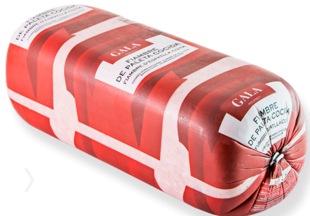
ref.2070 FIAMBRE BARRA II LA SELVA (3,5kg. x 2u.)