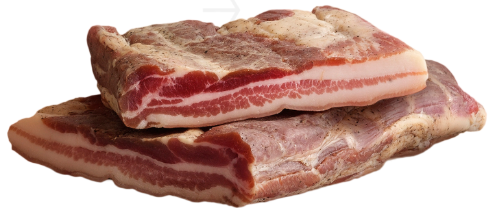
ref.2286 VENTRESCA S/PEBRE LA SELVA (2kg. x 3u.)