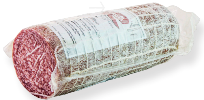
ref.2400 SALAMI MILANO 1/2 PEÇA RASPINI (1,5kg. x 6u.)