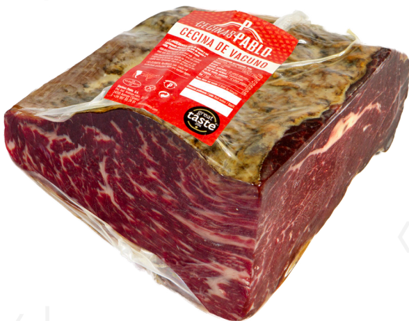
ref.2192 CECINA DE LEON TACS PABLO (1kg. x 8u.)