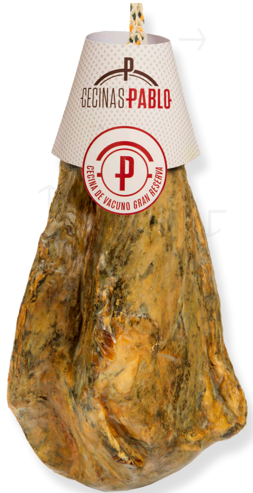
ref.2190 TAPA CECINA PABLO (2,75kg. x 2u.)