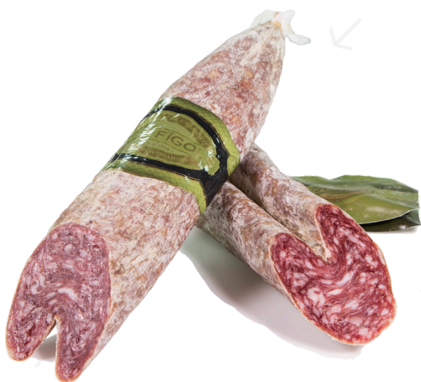
ref.2358 LLONGANISSA CELLER FIGOLS (1kg. x 3u.)