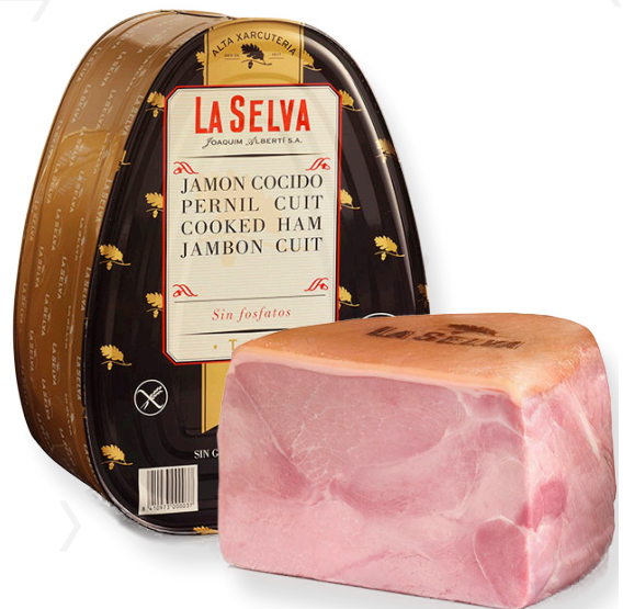
ref.2017 PERNIL COUIT EXTRA LLAUNA S/FOFATS LA SELVA (8kg. x 2u.)