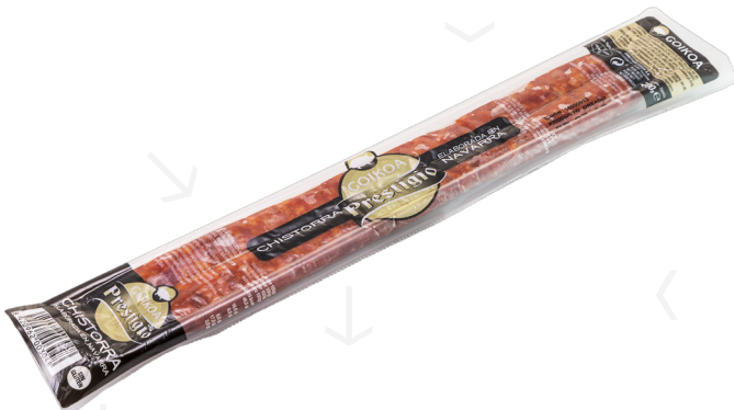
ref.2441 XISTORRA INDIVIDUAL GOIKOA (200gr. x 15u.)