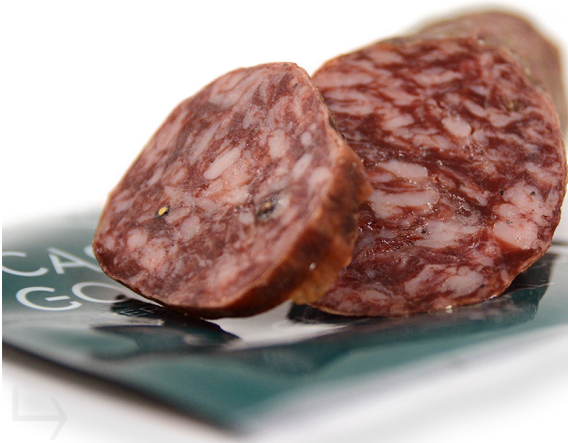
ref.2316 SALSITXO IBÈRIC DE GLÀ CASTRO & GONZALEZ (1kg. x 6u.)