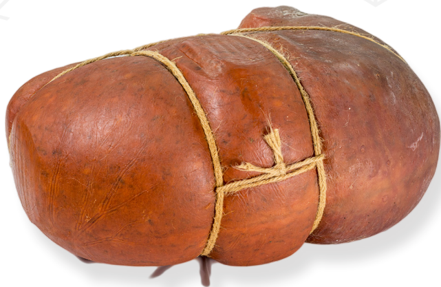
ref.2807 SOBRASSADA GEGANT ES PAGES (±.5kg.)