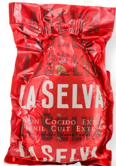
ref.2019 PERNIL CUIT EXTRA S/FOFATS ALUMINI LA SELVA (7kg. x 1u.)