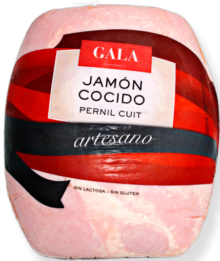
ref.2042 PERNIL CUIT EXTRA ARTESA LA SELVA (7kg. x 1u.)