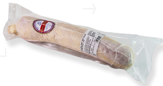
ref.2215 CATALANA CULAR SANT ROC MAX ZANDER (1kg. x 3u.)