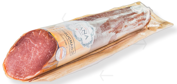
ref.2514 LLOM GRAN RVA. 1/2PEÇA ESPAÑA (800gr. x 9u.)