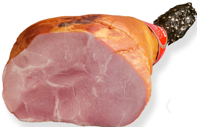
ref.2034 PERNIL CUIT EXTRA FUMAT LA SELVA (8kg. x 1u.)