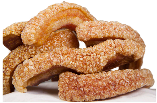
ref.2285 TORREZNO PRECUINAT LA HOGUERA (1,5kg. x 5u.)