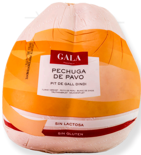
ref.2056 PIT DE DALL DINDI GALA LA SELVA (3,5kg. x 1u.)