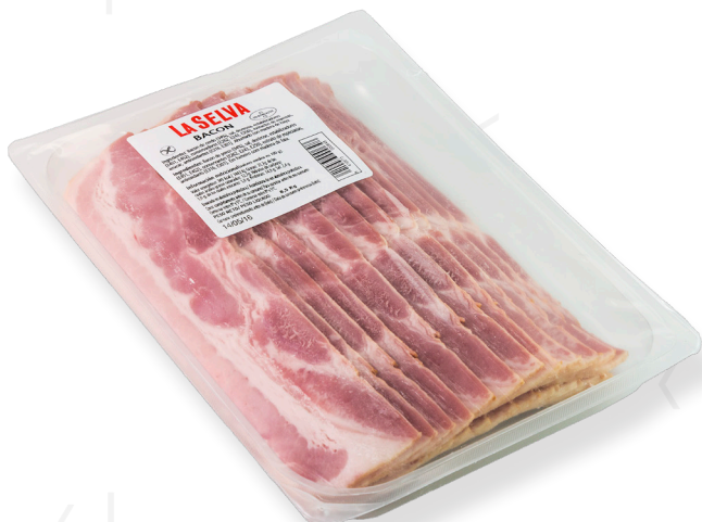
ref.2294 LLESQUES DE BACON LA SELVA (500gr. x 4u.)