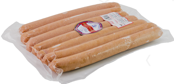
ref.2717 FRANKFURT 26 CM MAX ZANDER (1kg. x 6u.)