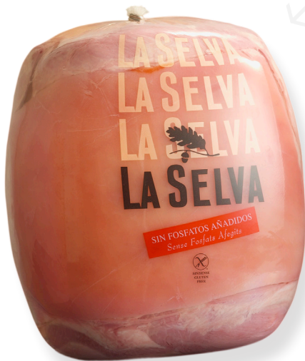
ref.2028 PERNIL CUIT EXTRA BUFFET S/FOFATS LA SELVA (7kg. x 1u.)