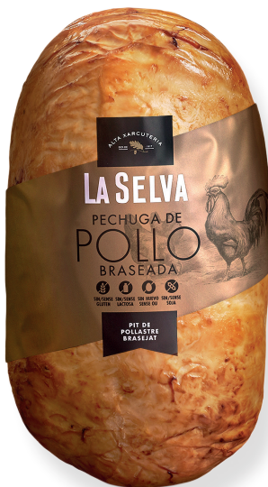
ref.2065 PIT DE POLLASTRE BRASEJAT LA SELVA (2,15kg. x 1u.)