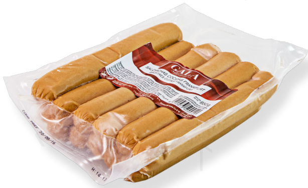
ref.2712 FRANKFURT GALA LA SELVA (12u. x 6u.)