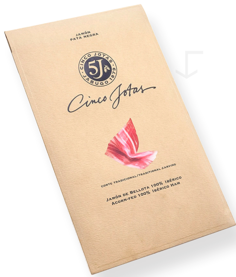
ref.2134,8 PERNIL IBÈRIC DE GLÀ 100% 5J SANCHEZ ROMERO CARVAJAL (80gr. x 12u.)