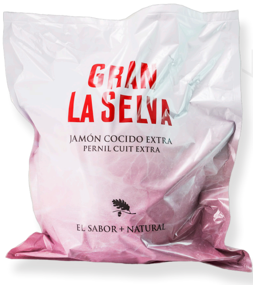
ref.2008 PERNIL COUIT EXTRA GRAN DUROC LA SELVA (8,5kg. x 1u.)