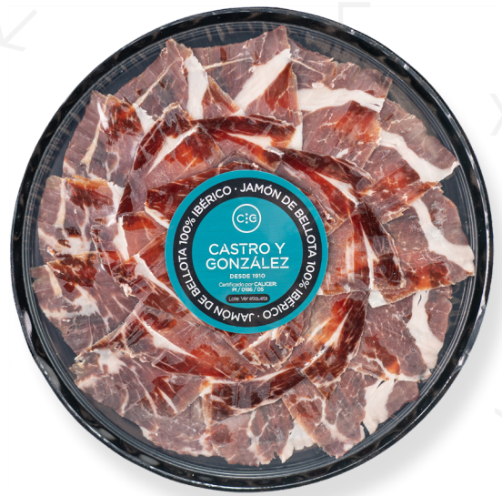
ref.2135 PERNIL IBÈRIC DE GLÀ 100% (TALLAT A MÀ) CASTRO&GONZALEZ (100gr. x 20u.)