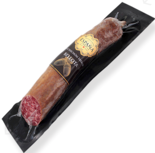
ref.2313,6 SALSITXO IBÈRIC CULAR ESPAÑA(600gr. x 8u.)