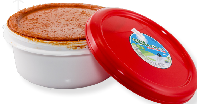
ref.2820 CREMA DE SOBRASSADA ES PAGES (3kg. x 2u.)