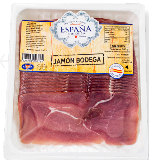
ref.2195 LLESQUES DE PERNIL IBÈRIC DE "CEBO" ESPAÑA (500gr. x 10u.)