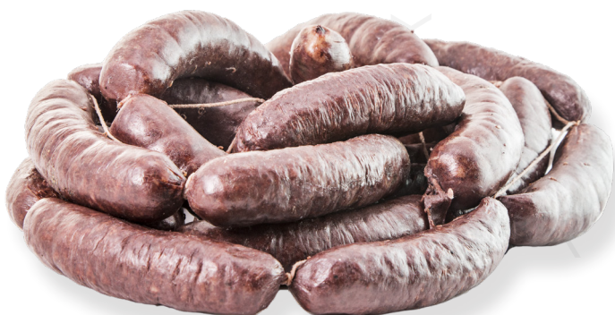
ref.2226 BALDANA D'ARRÒS DEL DELTA CURTO XARCUTERS (2kg. x 1u.)