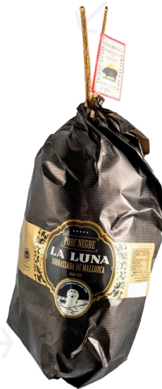
ref.2802 SOBRASSADA DE PORC NEGRE LA LUNA (500gr. x 6kg.)