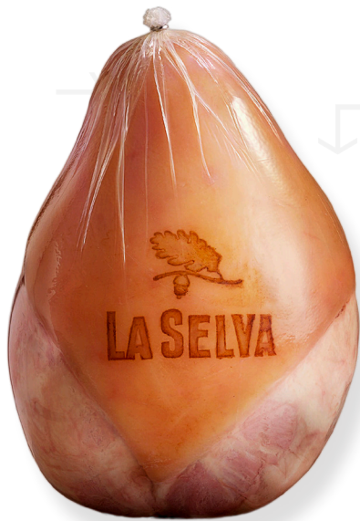
ref.2018 PERNIL CUIT EXTRA LA SELVA (7kg. x 1u.)