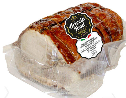
ref.2035 PORCHETA TRONCHETTO ARACCIA FOOD (2,1kg. x 1u.)