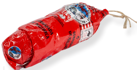
ref.2808 SOBRASSADA ARTESANAL "POLTRUS" ES PAGES (0'5kg. x 6kg.)