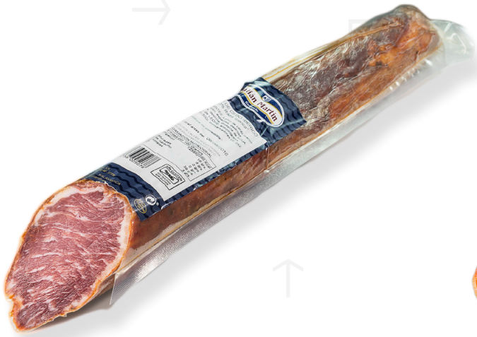
ref.2512 LLOM IBÈRIC "CEBO" 1/2PEÇA JULIAN MARTIN (600gr. x 6kg.)