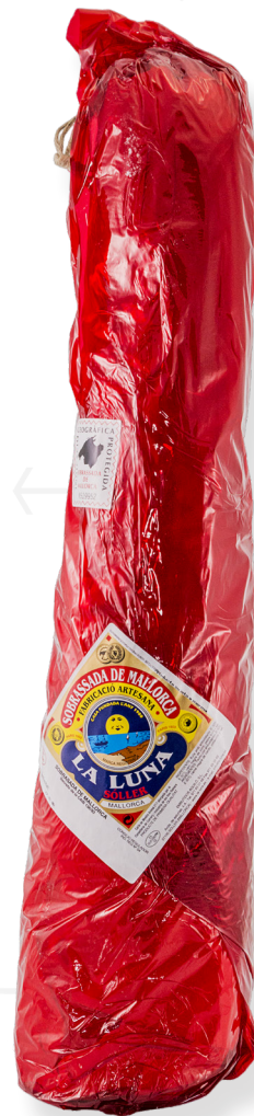
ref.2805 SOBRASSADA CULAR SUPERIOR LA LUNA (2,5kg. x 10kg.)