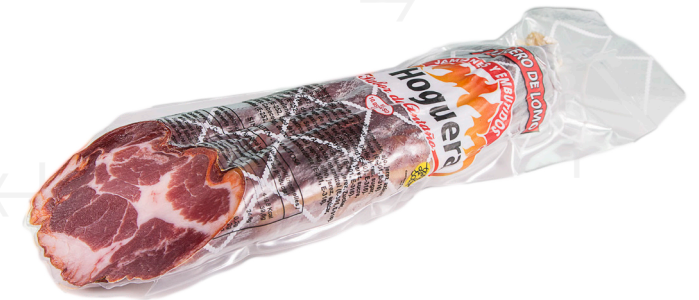
ref.2519 CAP DE LLOM LA HOGUERA (1kg. x 5u.)