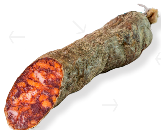
ref.2422 XORIÇ IBÈRIC DE CAMPANYA SELECCIÓ LEONCIO (1kg. x 6u.)