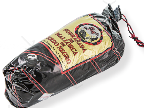
ref.2800 SOBRASSADA DE PORC NEGRE ES PAGES (800/1.000gr. x 6kg.)