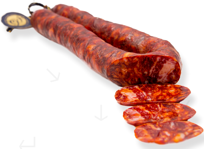
ref.2420 SARTA IBÈRICA DE GLÀ CASALBA (450gr. x 10kg.)