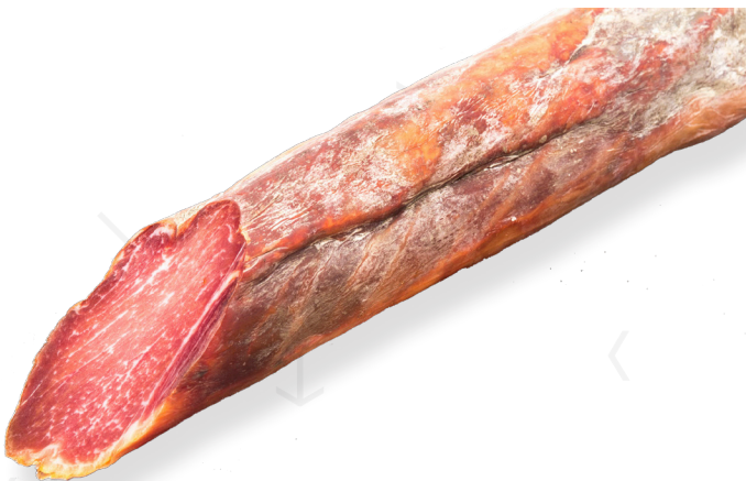
ref.2510 LLOM IBERIC "CEBO" LEONCIO (1kg. x 6u.)