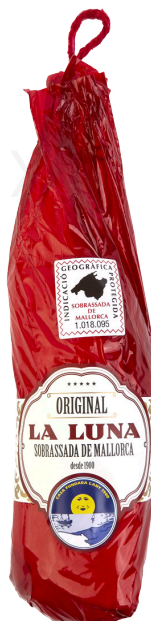
ref.2803 SOBRASSADA DOLÇA LA LUNA (500gr. x 6kg.)