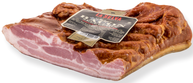
ref.2292,2 GRAN BACON SELECCIÓ 1/2 PEÇA LA SELVA (1,5kg. x 4u.)