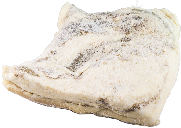
ref.2279 VENTRESCA IBÈRICA SANCHEZ ROMERO I CARVAJAL (25kg. x caixa.)