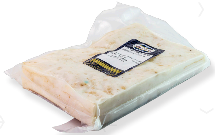
ref.2281 VENTRESCA IBÈRICA JULIAN MARTIN (1,5kg. x 4u.)