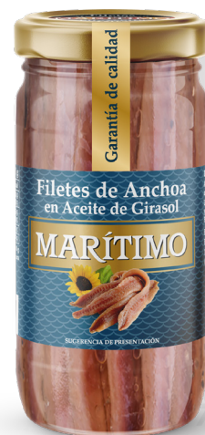
ref. 3030,4 ANXOVA AMB OLIVIA DE GIRASOL MARÍTIMO 100gr x 25u (15-25 filets).