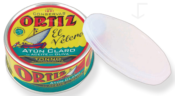
ref. 3476 TONYINA CLARA AMB OLI OLIVA RO-265 x 30u.