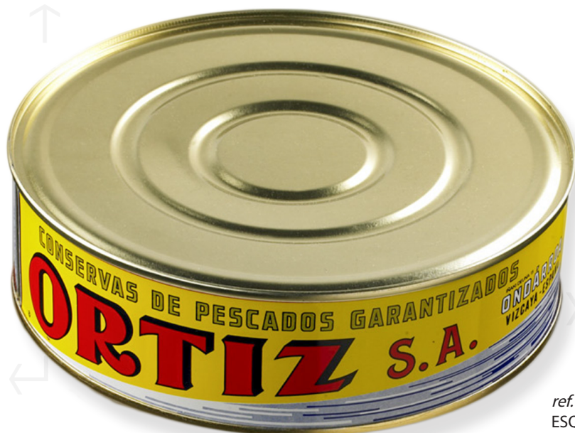
ref. 3486 ESQUEIXAT DE TONYINA CLARA AMB OLII OLIVA ORTIZ OL-1800 x 8u.