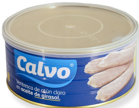
ref. 5879 VENTRESCA TONYINA CLARA CALVO RO-900 x 6u.