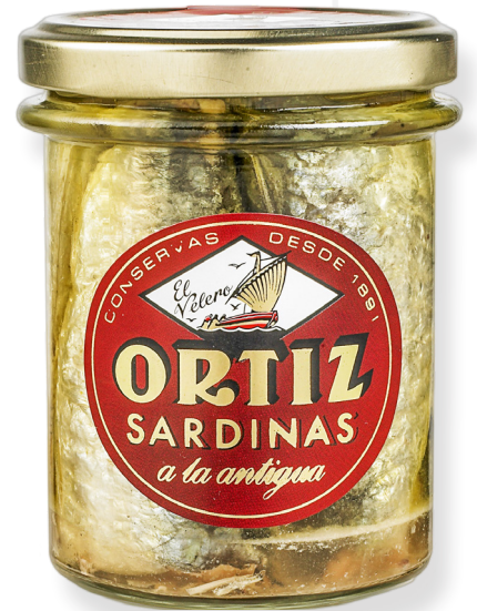
ref. 3500 SARDINES AMB OLI OLIVA ORTIZ RO-210 x 12u.