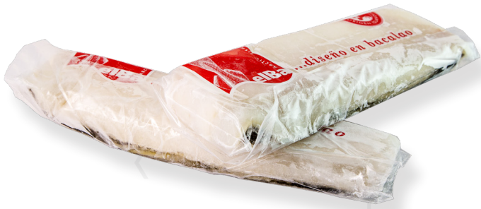
ref. 3142 BACALLÀ LLOM GOLDEN EXTRA ELBA +300gr.(caixa 2kg.)