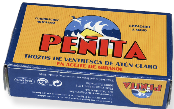
ref. 5900 TROSSOS VENTRESCA TONYINA CLARA PAÑITA OL-120 x 12u.