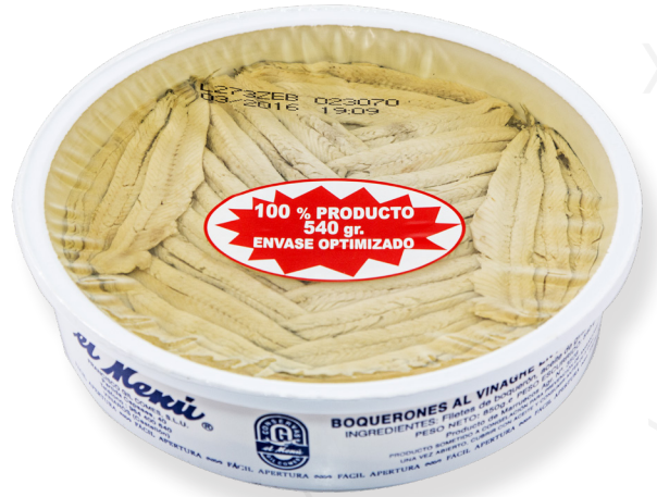
ref. 3046 BOQUERÓ AMB OLI VEGETAL EL MENÚ 600gr.( 75-80u.) x 6u.