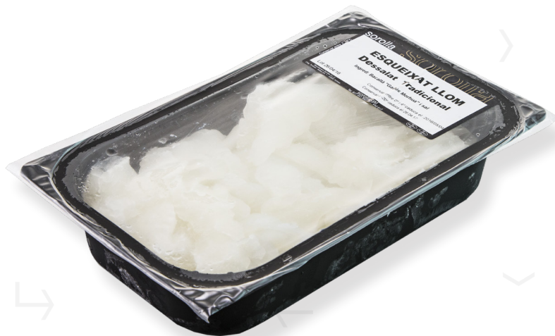
ref. *7016 LLOM DE BACALLÀ ESQUEIXAT (DESSALAT) SOROLLA 1kg. x 1u.