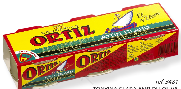
ref. 3481 TONYINA CLARA AMB OLI OLIVA ORTIZ RO-100 (x3) x 16u.