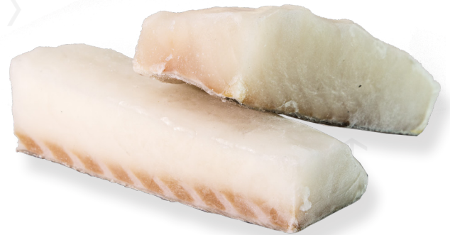
ref. 3146 BACALLÀ LLOM SECRETO ELBA- caixa 7kg.(5,6p.e.)