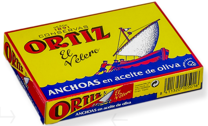
ref. 3425 ANXOVA AMB OLI OLIVA ORTIZ RR-85 x 24u.