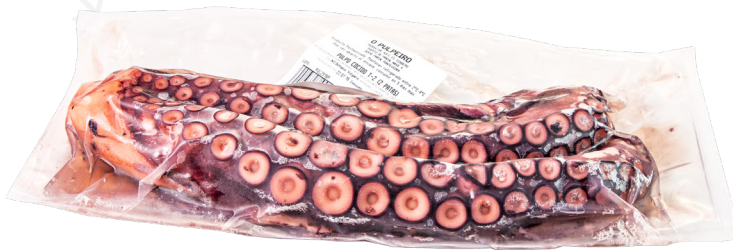
ref. *5866 2 POTES DE POP CUIT XXL +500gr. x 10kg.