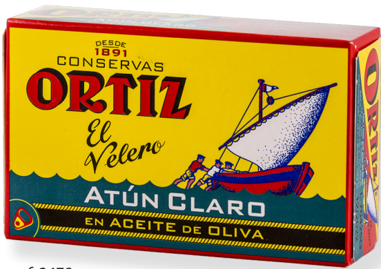
ref. 3478 TONYINA CLARA AMB OLI OLIVA RO-120 x 24u.