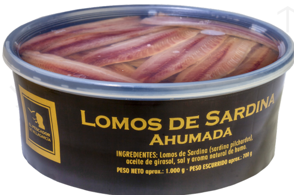
ref. 303 LLOMS DE SARDINA FUMADA 24-27 FILETS EL PESCADOR 700gr. x 6u.