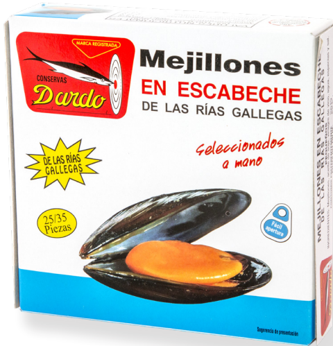
ref. 5834 MUSCLOS DE RIES GALLEGES 25/30 DARDO RO-280 x 36u.