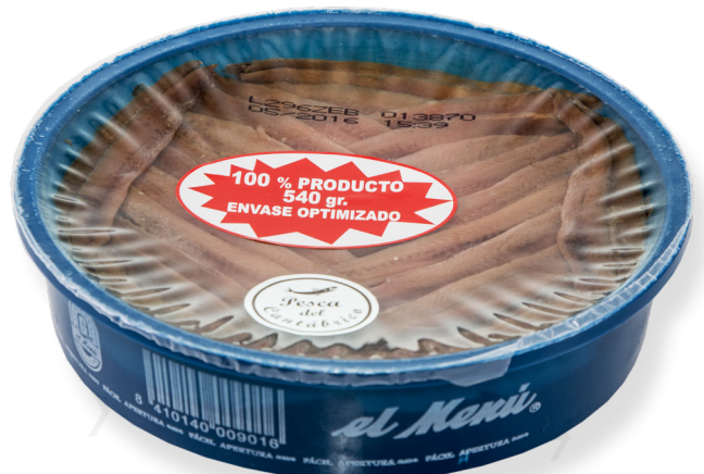
ref. 3012 ANXOVES AMB OLI OLIVA EL MENÚ 850gr.( 120u.) x 6u.