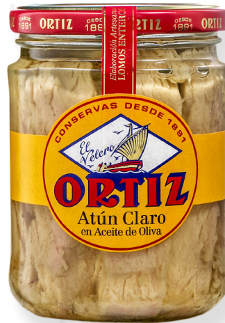
ref. 3480 TONYINA CLARA AMB OLI OLIVA RO-445 x 12u.