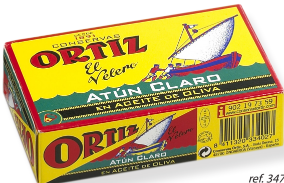
ref. 3478 TONYINA CLARA AMB OLI OLIVA ORTIZ RO-120 x 24u.