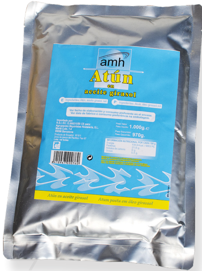
ref. 5881 TONYINA CLARA AMH BOSSA 1kg. x 16u.