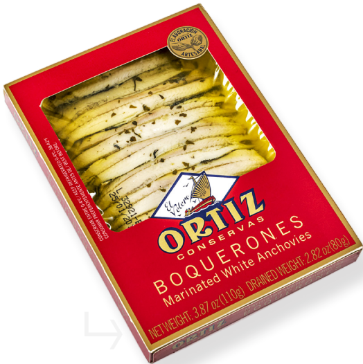
ref. 3469 BOQUERONS AMB OLI OLIVA, ALL I JULIVERT ORTIZ 110gr. x 12u.