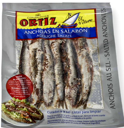
ref. 3440 ANXOVA GRAN AMB SALAÓ ORTIZ 80gr.(11p.) x 12u.