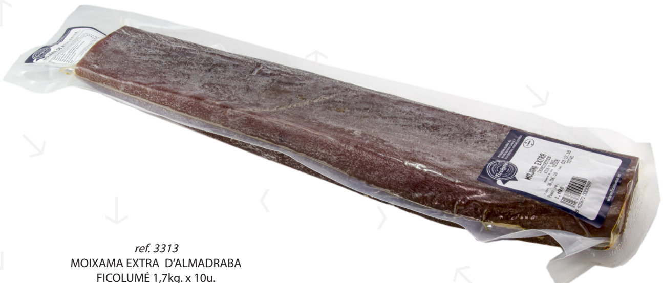
ref. 3313 MOIXAMA EXTRA D'ALMADRABA FICOLUMÉ 1,7kg. x 10u.