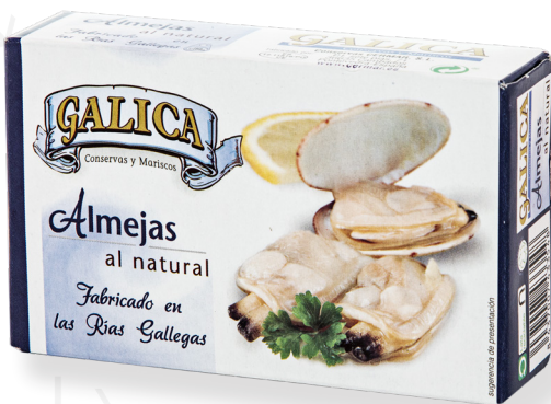
ref. 5804 CLOÏSSES AL NATURAL GALICA OL-120 x 24u.