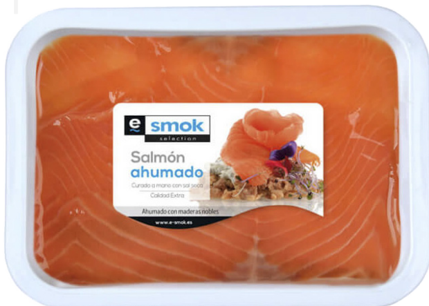
ref. 3200 SALMÓ FUMAT AMB OLI E-SMOK (400gr. x 6u.)