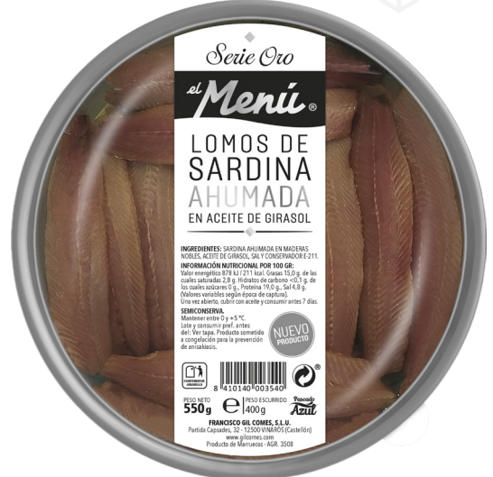
ref. 3036 LLOMS DE SARDINA FUMADA 24-27 FILETS EL MENÚ 550gr. x 4u.