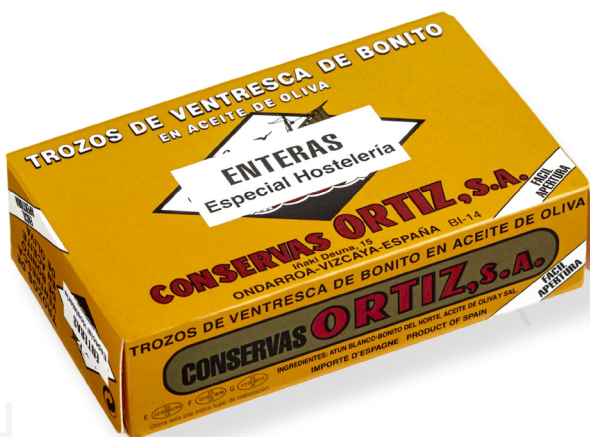
ref. 3472,4 VENTRESCA DE BONÍTOL AMB OLI OLIVA OL-120 x 24u. ESPECIAL HOSTELERIA