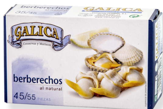
ref. 5823 ESCOPIÑYES 45/55 BAYMAR OL-120 x 10u.