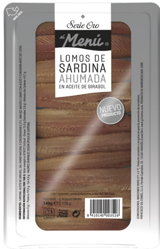
ref. 3037 LLOMS DE SARDINA FUMADA 8-10 FILETS EL MENÚ 140gr. x 8u.