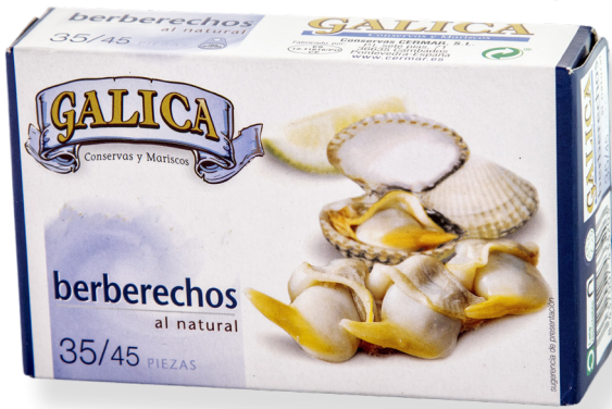
ref. 5828 ESCOPINYES AL NATURAL 35/45 GALICA RR-120 x 12u.