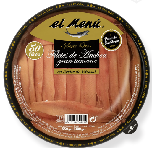
ref. 3011,2 ANXOVES GRAN TAMANY CANTÀBRIC GIRASOL EL MENÚ 600gr.( 50u.) x 6u.