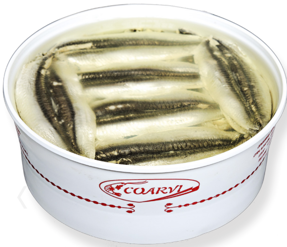
ref. 3038 BOQUERÓ (PALOMETA) COARVI 35 peixos. x 6u.