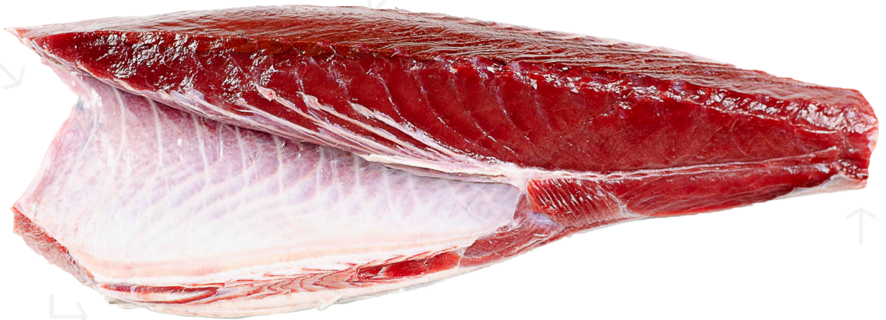
ref. 0706 LLOM BAIX DE TONYINA ROJA SALVATGE JC MACKINTOSH 7-8 kg.