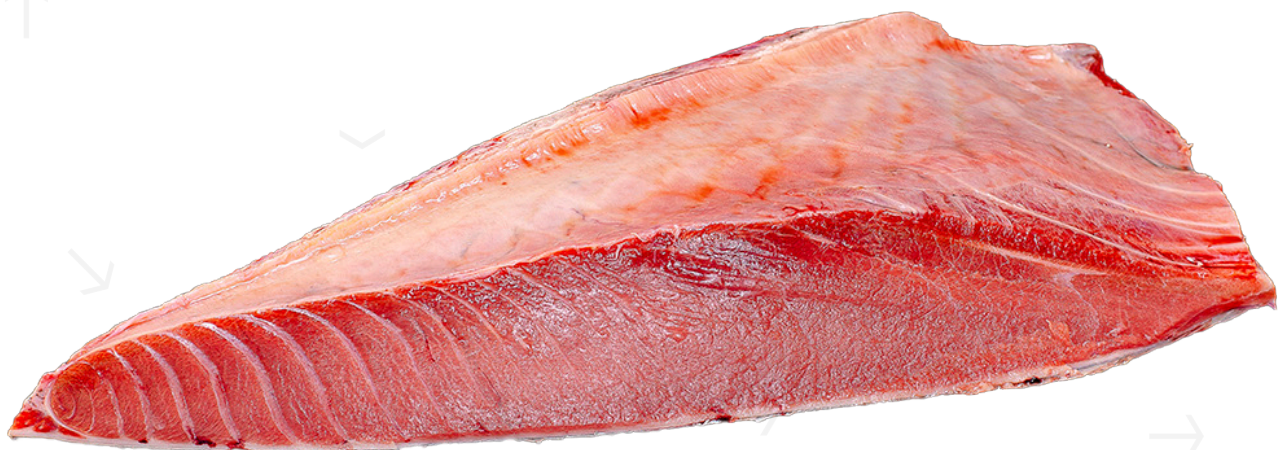
ref. 0707 VENTRESCA DE TONYINA ROJA SALVATGE JC MACKINTOSH 2-3 kg.