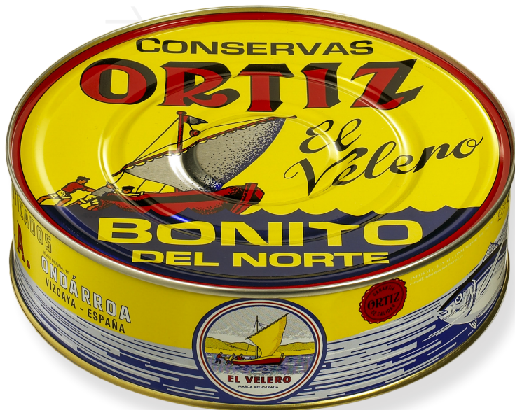
ref. 3486 BONÍTOL AMB OLII OLIVA OL-1800 x 8u.