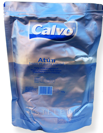
ref. 5883 TONYINA CLARA CALVO BOSSA 1kg. x 16u.