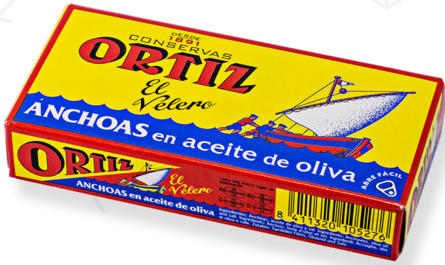
ref. 3430 ANXOVA AMB OLI OLIVA ORTIZ RR-50 x 50u.