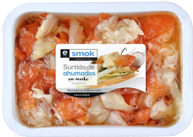
ref. 3248 MESCLA DE FUMATS E-SMOK(400gr. x 4 u.)