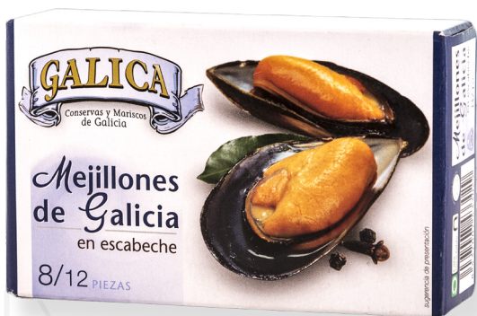
ref. 5838 MUSCLOS DE RIES GALLEGES 8/12 GALICA OL-120 x 5u.