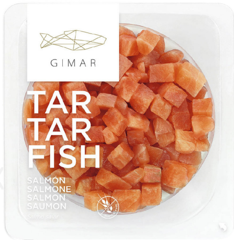
ref. 3212 TARTARFISH DE SALMÓ GIMAR 100gr. x 6u.