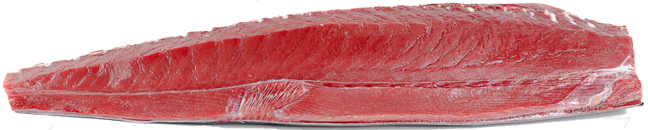
ref. 0705 LLOM ALT DE TONYINA ROJA SALVATGE JC MACKINTOSH 5-6 kg.