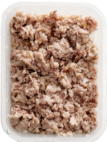
ref. 3062 ESQUEIXAT D'ANGUILA FUMADA ROSET (250gr. x 4u.)