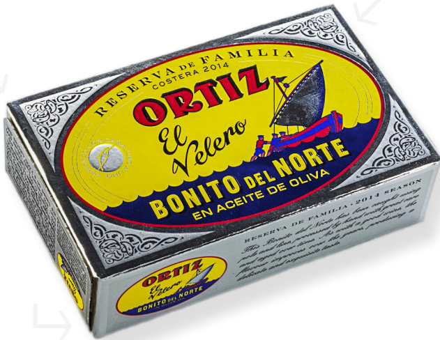
ref. 3468 BONÍTOL AMB OLI OLIVA RVA. DE LA FAMILIA OL-120 x 24u.