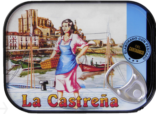
ref. 3015,2 ANXOVA DEL CANTABRIC OLIVIA LA CASTREÑA RR-80 x 12u.