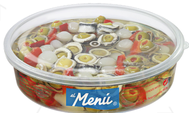
ref. 3082 "BANDERILLAS" ANXOVA-BOQUERÓ EL MENÚ 25 u. x 6u.