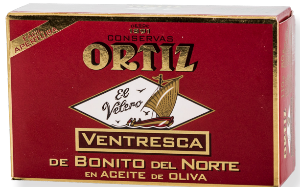
ref. 3472 VENTRESCA DE BONÍTOL AMB OLI OLIVA OL-120 x 24u.