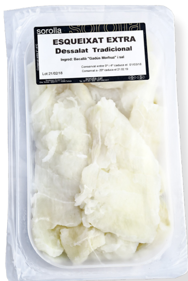
ref. 3104 ESQUEIXAT BACALLÀ EXTRA SOROLLA 250gr. x 1u.