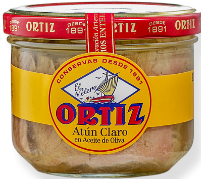
ref. 3479 TONYINA CLARA AMB OLI OLIVA RO-262 x 12u.