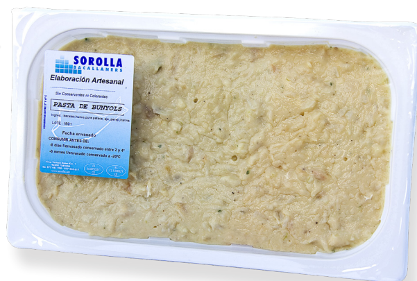
ref. 3212 PASTA DE BACALLÀ SOROLLA 1kg. x 4u.