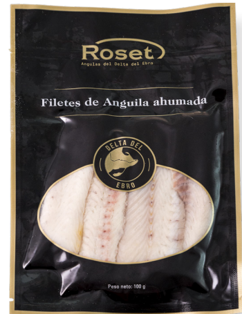
ref. 3060 FILETS D'ANGUILA FUMADA ROSET (100gr. x 10 u.)