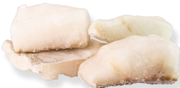
ref. 3149 BACALLÀ TROSSOS "TAPEO" ELBA - caixa 7kg.