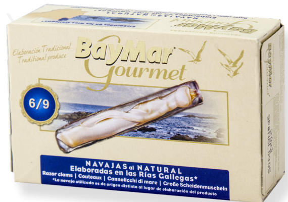
ref. 5853 NAVALLES DE RIA GOURMET 6/9 BAYMAR OL-120 x 50u.