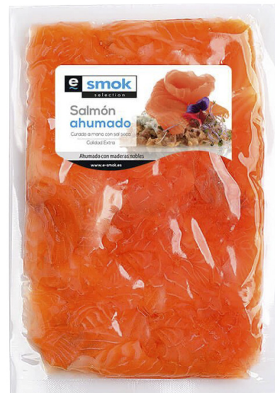
ref. 3214 TROSSOS DE SALMÓ FUMAT AMB OLI E-SMOK Bossa 1kg. x 10u.