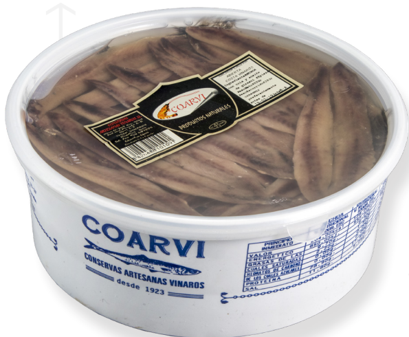
ref. 3014 ANXOVA DE LA COSTA (PALOMETA) COARVI 45 peixos. x 6u.