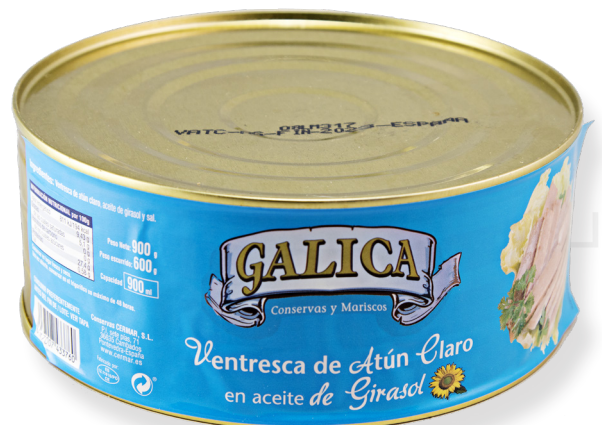
ref. 5896 VENTRESCA TONYINA CLARA GALICA RO-800 x 6u.