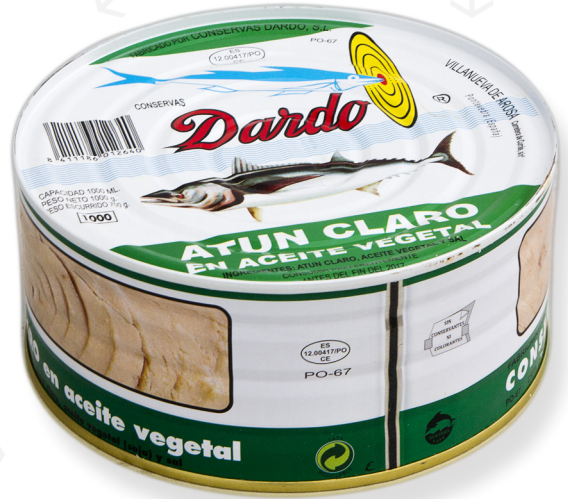
ref. 5874 TONYINA CLARA DARDO RO-1000 x 12u.