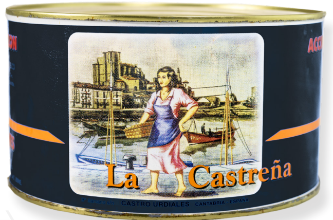
ref. 3007 ANXOVES CANTABRIC AMB SALAÓ LA CASTREÑA (10P/C - 16C) 5kg. x 4u.