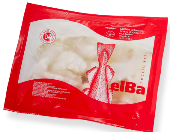
ref. 3140 MOLLES DE BACALLÀ ELBA 500gr. x 8u.