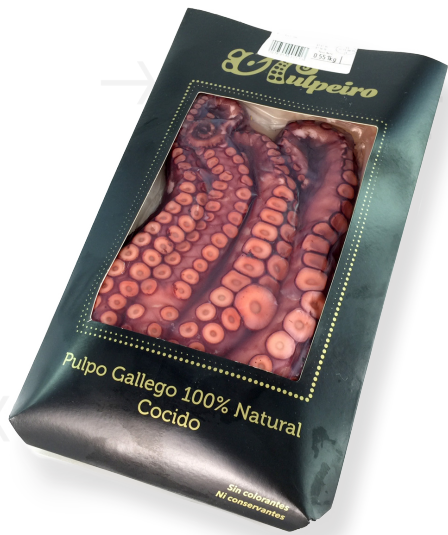
ref. 5856,4 POTES DE POP CUIT T4 (MITGANES) 500gr.(4u.) x 8kg.