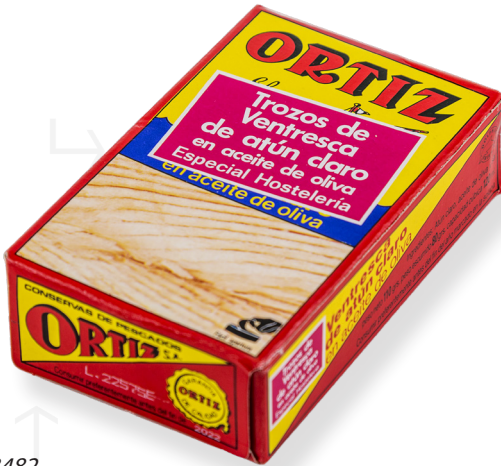
ref. 3482 VENTRESCA DE TONYINA CLARA AMB OLI OLIVA OL-120 x 24u.