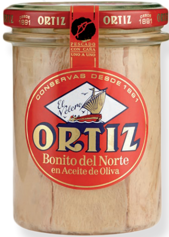
ref. 3470 BONÍTOL AMB OLI OLIVA RO-260 x 12u.