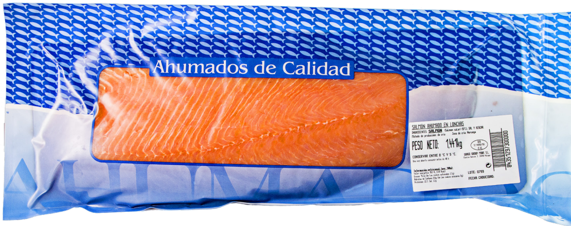
ref. 3204 SALMÓ NORUEG FUMAT I LLESCAT 1,4 kg. x 5u.