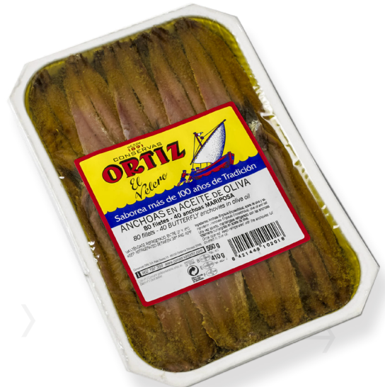
ref. 3420 ANXOVA "MARIPOSA" OLI OLIVA ORTIZ V40u. x 8u.