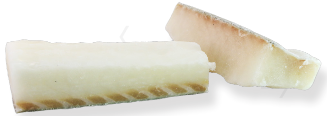
ref. 3122 BACALLÀ TRADICIONAL, LLOM (GRIMSEY) ELBA - caixa 5kg..(+10u.)