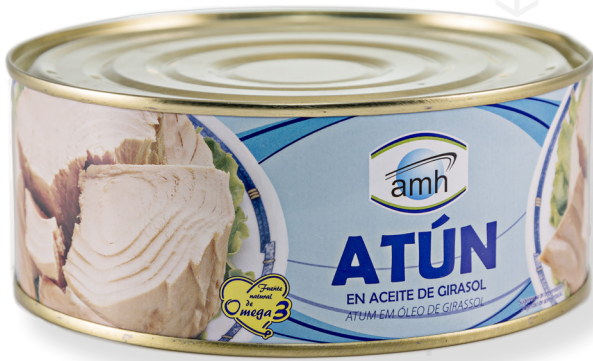
ref. 5878 TONYINA CLARA AMH RO-900 x 12u.