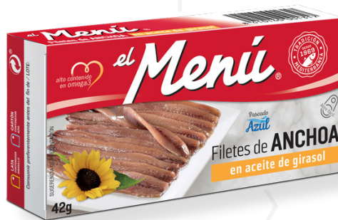
ref. 3016 ANXOVA AMB OLIVIA DE GIRASOL EL MENÚ 42gr x 25u (9-15 filets).