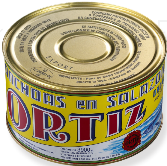
ref. 3416 ANXOVES AMB SALAÓ ORTIZ (10P/C - 16C) 5kg. x 4u.