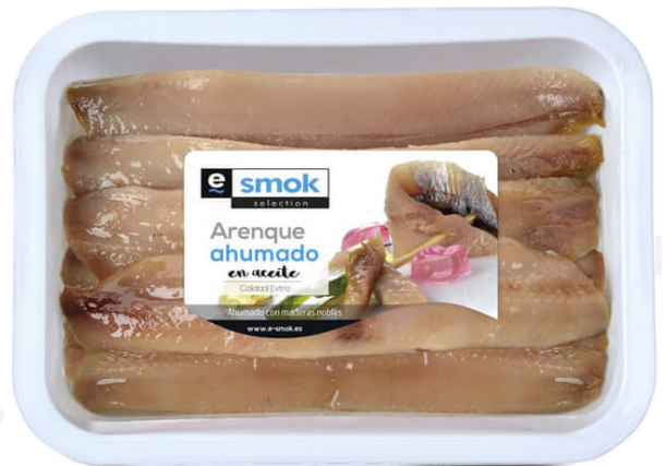
ref. 3090 "ARENQUE" FUMAD E-SMOK (400gr. x 4 u.)