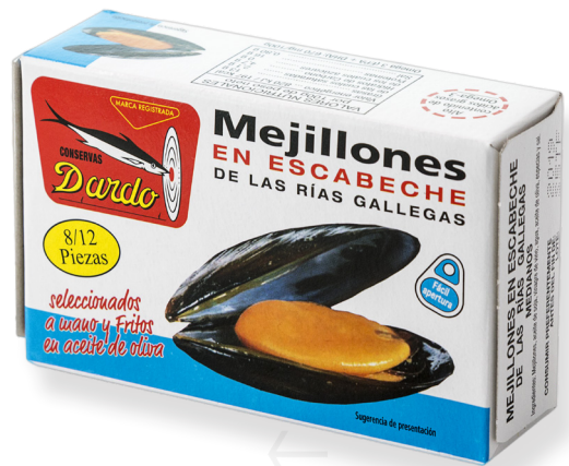
ref. 5845 MUSCLOS DE RIES GALLEGES 8/12 DARDO OL-120 x 5u.