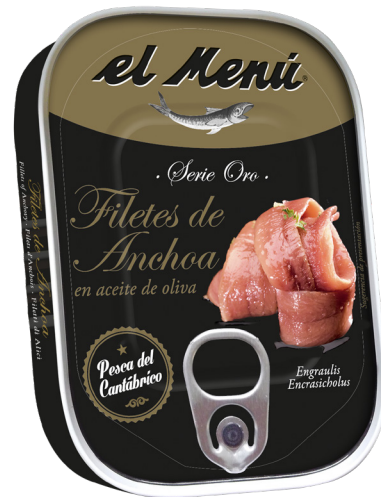
ref. 3022 ANXOVA DEL CANTABRIC OLIVIA EL MENÚ 125gr x 12u (10-12 filets).