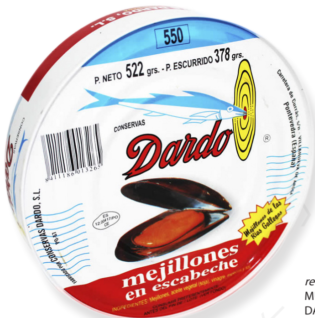
ref. 5840 MUSCLO DE RIA GEGANT 15/20 DARDO RO-550 x 12u.