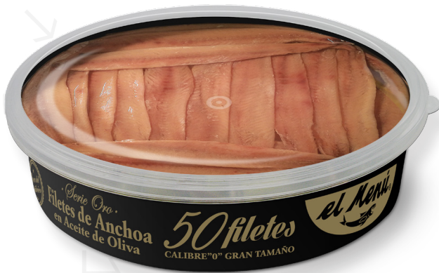
ref. 3011 ANXOVES GRAN TAMANY CANTÀBRIC OOV EL MENÚ 600gr.( 50u.) x 6u.