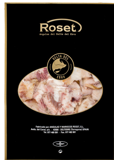
ref. 3064 TROSSOS D'ANGUILA FUMADA ROSET (250gr. x 4u.)