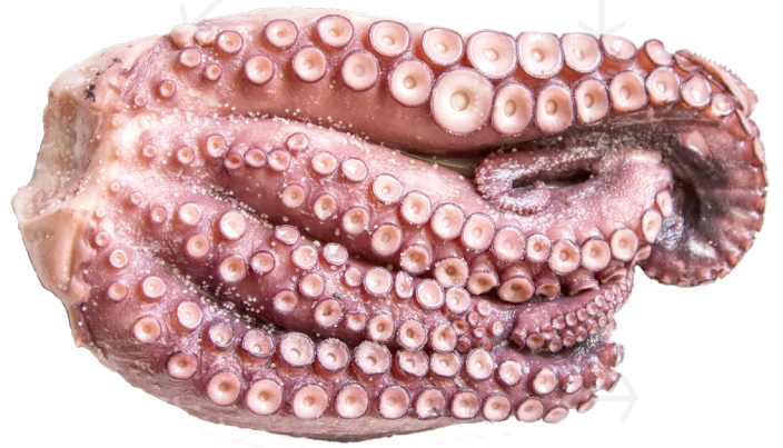
ref. 585 POTES DE POP CUIT T5(PETITES) -400gr.(4u.) x 6kg.