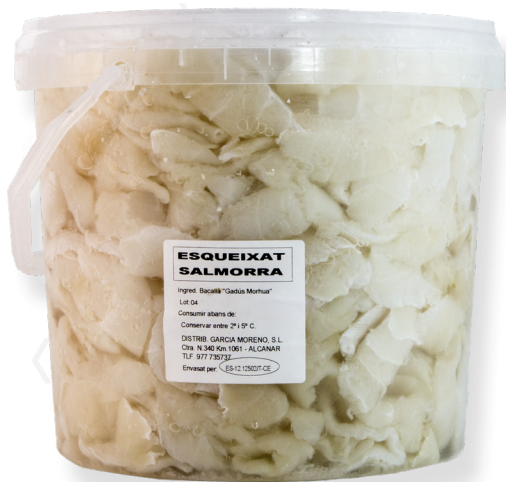
ref. 3103 BACALLÀ ESQUEIXAT AMB SALMORRA SOROLLA 5kg. x 1u.