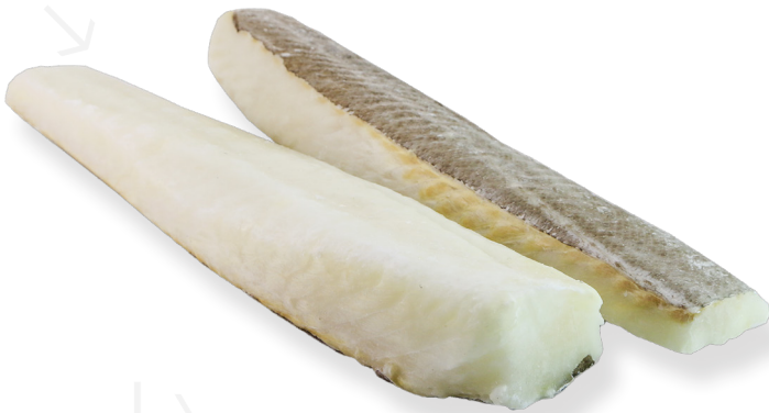
ref. 3144 BACALLÀ TRADICIONAL, LLOM (OCEANIC) ELBA - caixa 7kg.(+10u.)