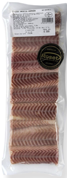
ref. 3059 LLOMS D'ANGUILA FUMADA SELECCIÓ ROSET (500gr. x 10u.)