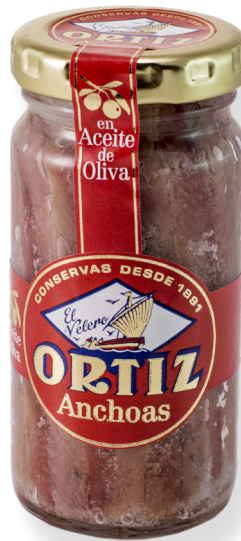
ref. 3435 ANXOVA ANMB OLI OLIVA ORTIZ RO-100 x 15u.