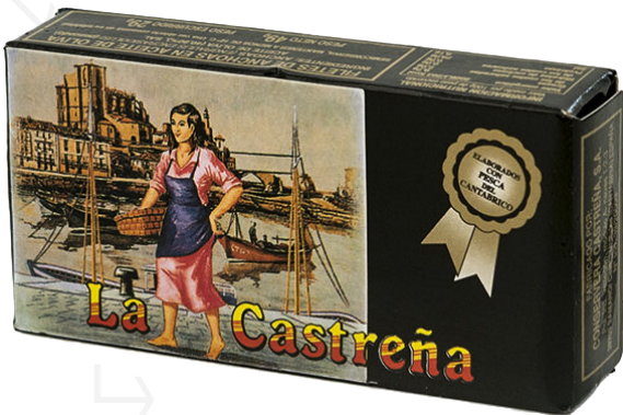
ref. 3015,4 ANXOVA DEL CANTABRIC OLIVIA LA CASTREÑA RR-50 x 12u.