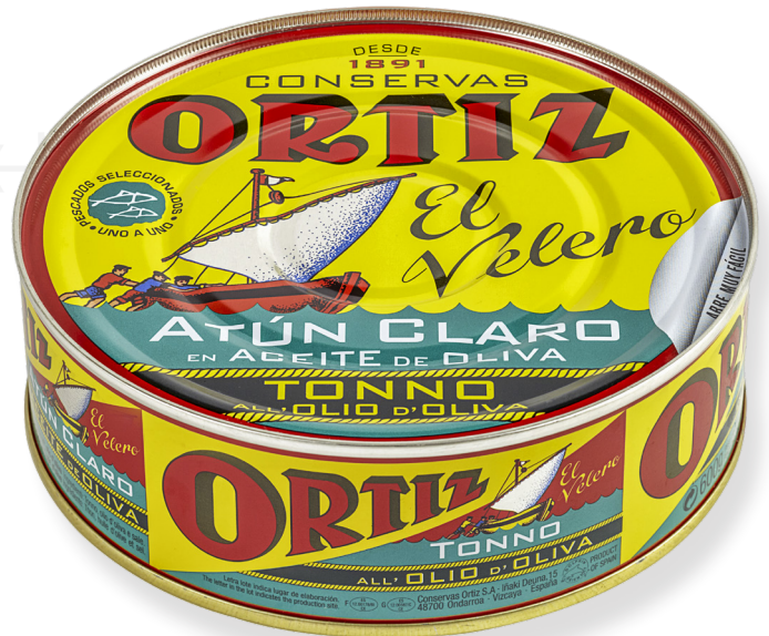
ref. 3475 TONYINA CLARA AMB OLI OLIVA ORTIZ RO-700 x 18u.