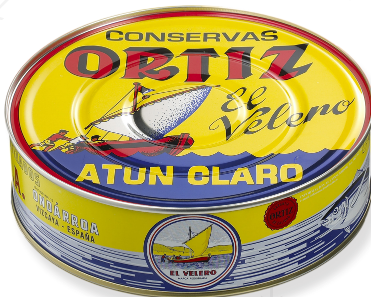
ref. 3474 TONYINA CLARA AMB OLII OLIVA ORTIZ RO-1800 x 8u.