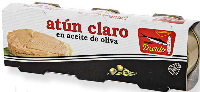
ref. 5893 TONYINA CLARA AMB OLI OLIVA DARDO RO-85( PACK 3u.) x 12u.