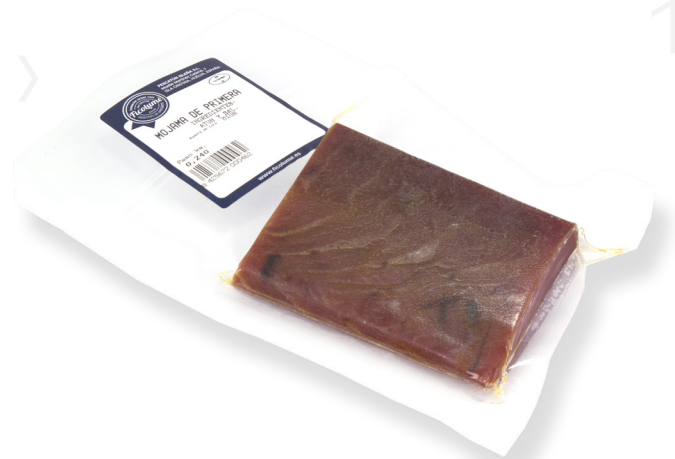
ref. 3313 MOIXAMA 1ª DE TONYINA FICOLUMÉ 0,3kg. x 10u.