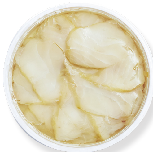
ref. 3215,4 BACALLÀ LAMINAT AMB OLI SKANDIA 500gr. x 4u.