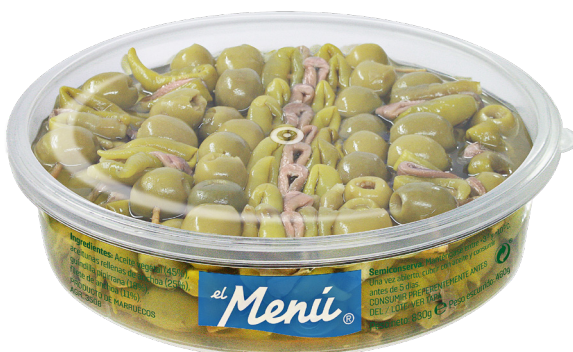
ref. 3086 "BANDERILLAS GILDAS" EL MENÚ 30 u. x 6u.