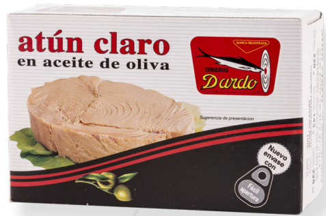
ref. 5890 TONYINA CLARA AMB OLI OLIVA DARDO OL-120 x 12u.