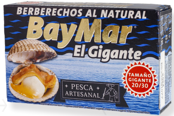
ref. 5819 ESCOPINYES 20/30 BAYMAR OL-120 x 10u.