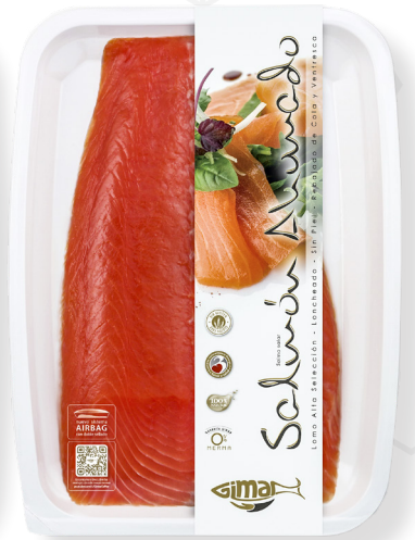
ref. 3201 SALMÓ NORUEG FUMAT BIPACK GIMAR 1,2 kg. x 1u.