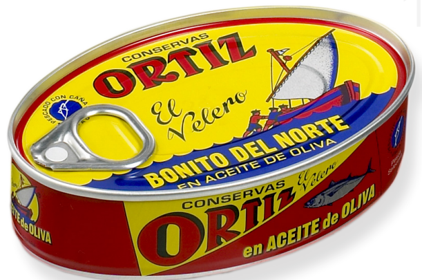
ref. 3464 BONÍTOL AMB OLI OLIVA OL-120 x 30u.