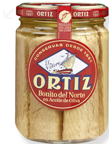
ref. 3467 BONÍTOL AMB OLI OLIVA RO-445 x 12u.