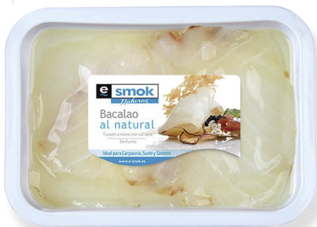
ref. 3216,2 BACALLÀ LAMINAT AMB OLI E-SMOK 400gr. x 2u.