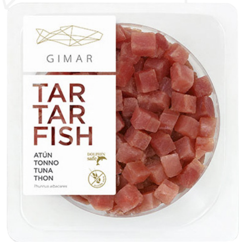
ref. 3234 TARTARFISH DE TONYINA GIMAR 100gr. x 6u.