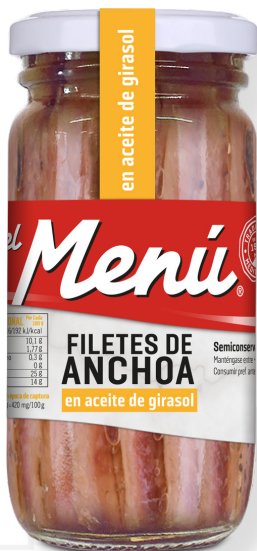
ref. 3022 ANXOVA DEL CANTABRIC OLIVIA EL MENÚ 125gr x 12u (10-12 filets).