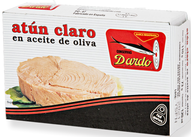
ref. 5888 TONYINA CLARA AMB OLI OLIVA DARDO RO-240 x 12u.