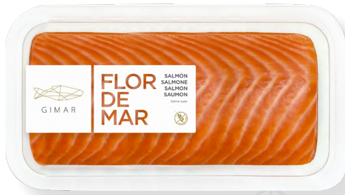
ref. 3205 LLOM SALMÓ NORUEG FUMAT GIMAR 200gr. x 6u.