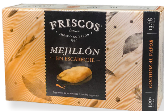
ref. 5846 MUSCLOS DE RIES GALLEGES 13/18 FRISCOS OL-120 x 5u.