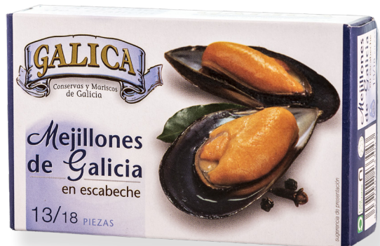
ref. 5848 MUSCLOS DE RIES GALLEGES 13/18 GALICA OL-120 x 5u.