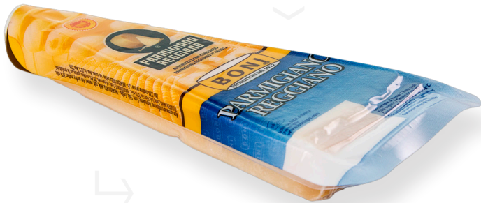
ref.1598 PARMESANO REGIANO D.O.P. BONI (200gr. x 12u.)