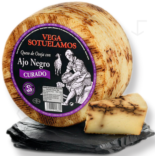
ref.1015,4 OVELLA CURAT, AJO NEGRO LAVEGA (3kg. x 2u.)