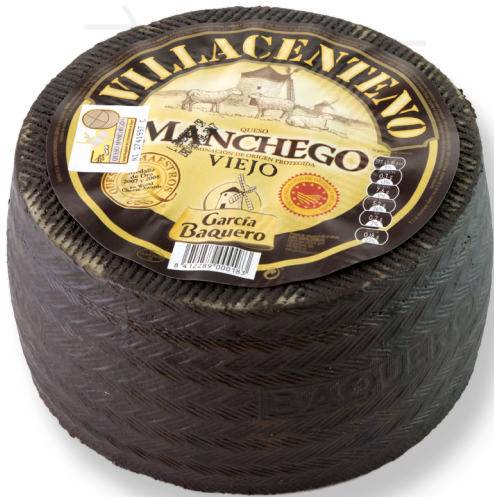
ref.1004,8 OVELLA CURAT VELL, D.O. LA MANCHA GARCIA BAQUERO (3kg. x 2u.)