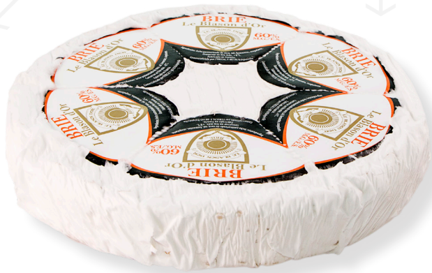
ref.1360 BRIE 60% FRANCÈS LA BLANSON D'OR (1,7kg. x 6u.)