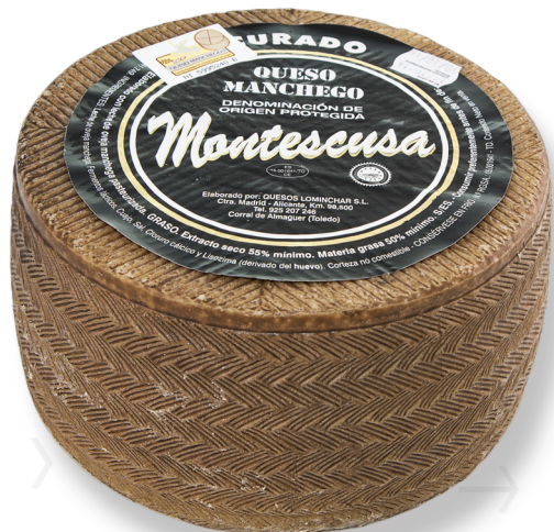
ref.1003 OVELLA CURAT, D.O. LA MANCHA MONTESCUSA (3kg. x 2u.)