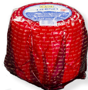
ref.1215 BOLA TENDRA CADI (1,7kg. x 6u.)