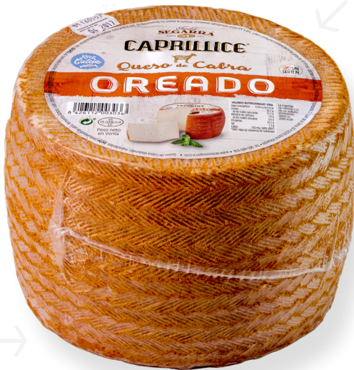
ref.1124 CABRA OREADO CAPRILLICE (2,5kg. x 2u.)