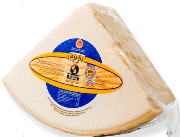
ref.1278 PARMESANO REGGIANO 22/24 MESOS D.O.P. BONI (4,5kg. x 2u.)