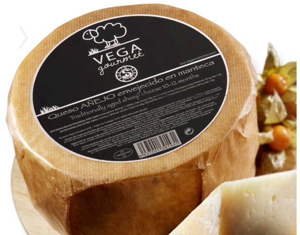
ref.1014,2 OVELLA GRAN RESERVA MANTECA VEGA GOURMET (3kg. x 2u.)