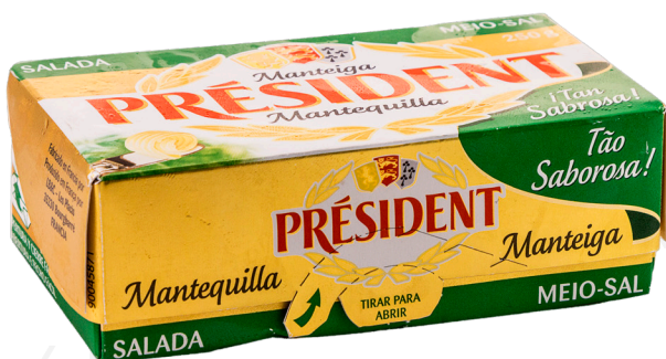
ref.1541 MANTEGA PRESIDENT (250gr. x 20u.)