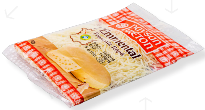
ref.1577 RATLLAT EMMENTAL FRANCÈS PAYSON BRETON (70gr. x 20u.)