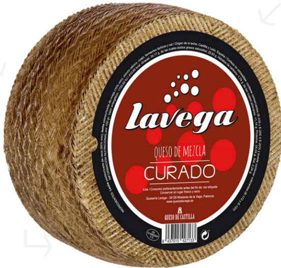
ref.1019,8 CURAT MESCLA LA VEGA (3kg. x 2u.)