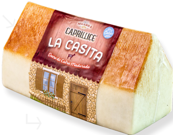
ref.1126 LA CASITA DE CABRA MADURAT CAPRILLICE (2,5kg. x 2u.)