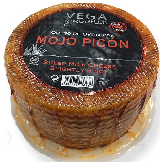
ref.1015,2 OVELLA CURAT, MOJO PICON VEGA GOURMET (3kg. x 2u.)