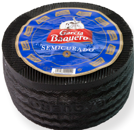
ref.1050 SEMICURAT GARCIA BAQUERO (3kg. x 2u.)