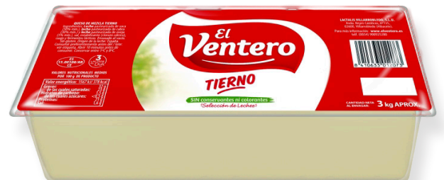
ref.1075 BARRA TENDRA EL VENTERO (3kg. x 2u.)