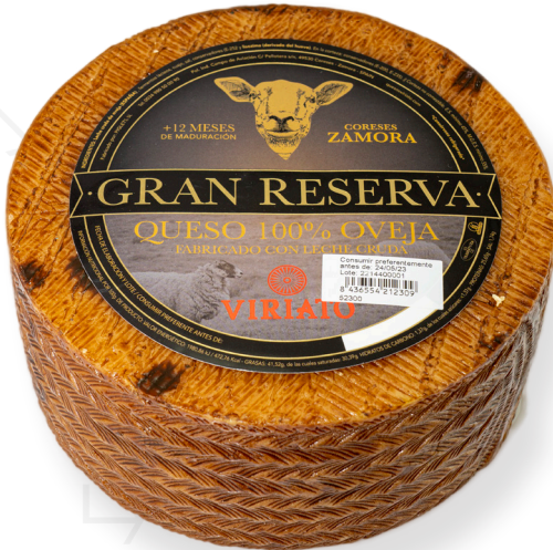
ref.1005,4 OVELLA LLET CRUA GRAN RESERVA VIRIATO (3kg. x 2u.)