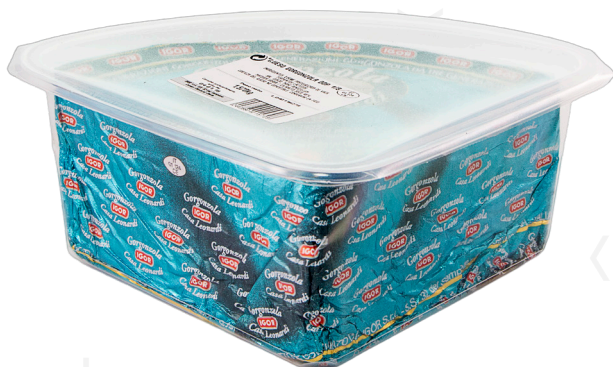
ref.1314 GORGONZOLA DOLCE 1/8 D.O.P. PALADIN (1,5kg. x 4u.)