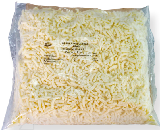
ref.1411 PREPARAT LACTIC RATLLAT STAR (2kg. x 6u.)