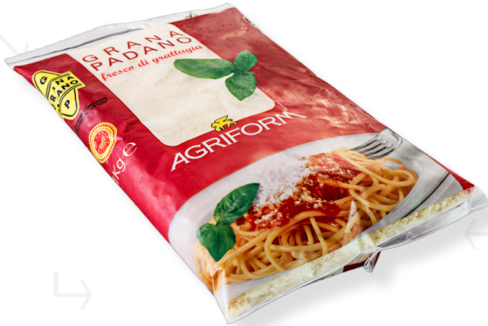
ref.1413 RATLLAT GRANA PADANO D.O.P. AGRIFORM (1kg. x 10u.)