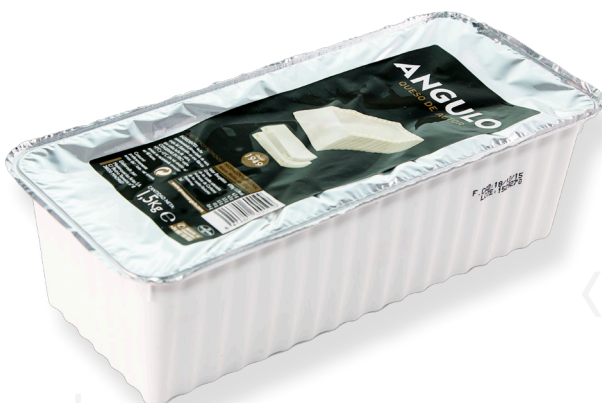
ref.1072 BARRA BURGOS ANGULO (1,5kg. x 2u.)