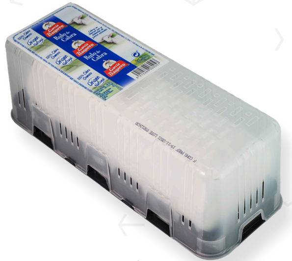
ref.1148 RULO CABRA GARCIA BAQUERO (1kg. x 2u.)