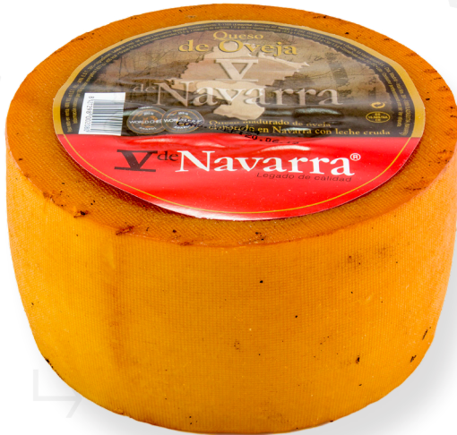
ref.1145 OVELLA FUMAT (TIPO IDIAZABAL) V DE NAVARRA (3kg. x 2u.)