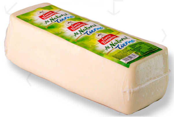
ref.1072 BARRA TENDRA NATURAL GARCIA BAQUERO (2,5kg. x 2u.)