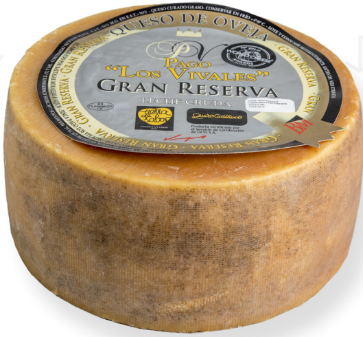
ref.1004 OVELLA CURAT GRAN RESERVA, LLET CRUA PAGO LOS VIVALES (3,2kg. x 2u.)