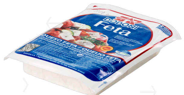
ref.1708 FETA DODONI (200gr. x 12u.)