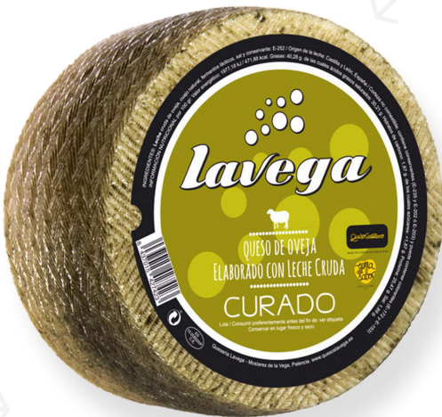
ref.1014 OVELLA CURAT, LLET CRUA LA VEGA (3kg. x 2u.)