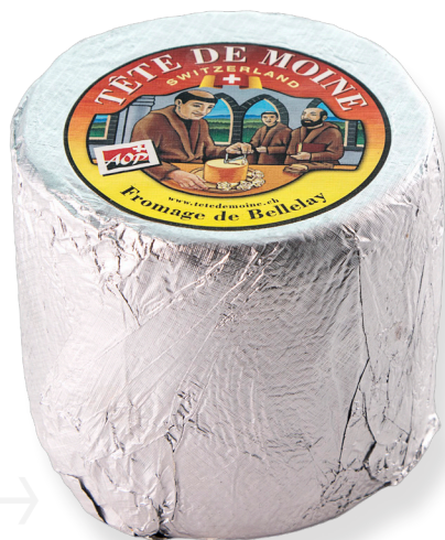
ref.1272 TÊTE DE MOINE AOC (0,8kg. x 4u.)