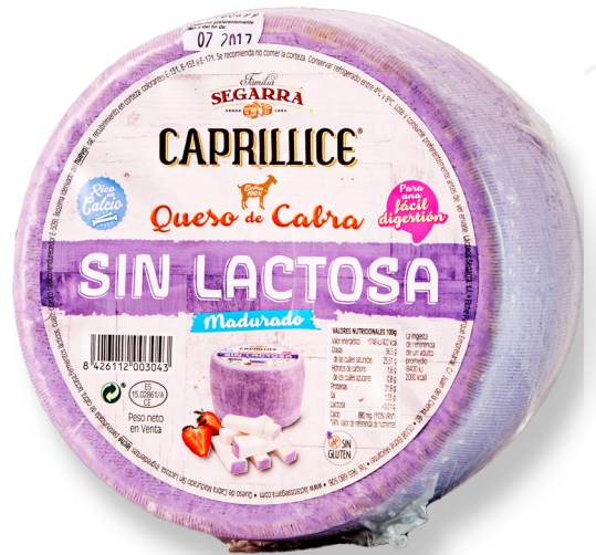
ref.1120 CABRA MADURAT SENSE LACTOSA CAPRILLICE (2,5kg. x 1u.)