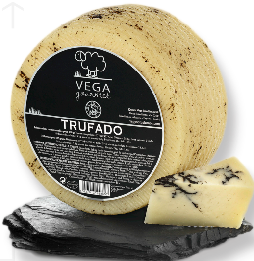
ref.1015 OVELLA CURAT TRUFAT VEGA GOURMET (3kg. x 2u.)