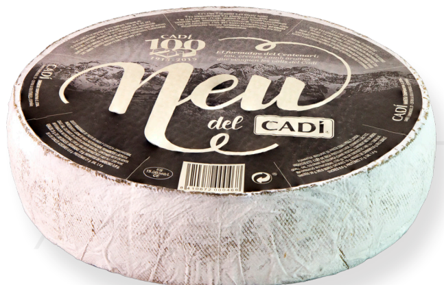
ref.1362 FORMATGE NEU CADI (2,2kg. x 2u.)