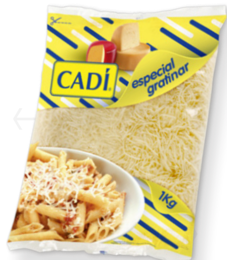
ref.1414 RATLLAT GRATEN CADI (1kg. x 10u.)