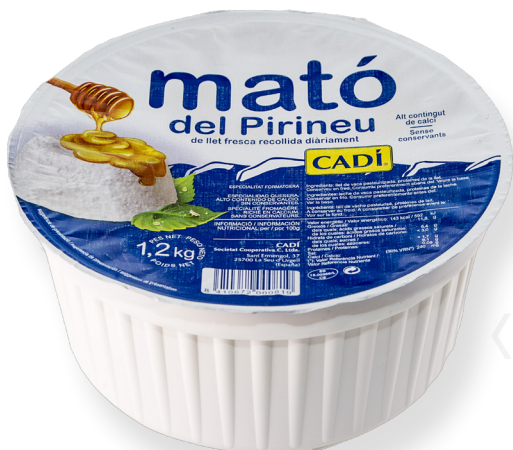
ref.142 MATO DEL PIRINEU CADI (1,2 kg. x 2u.)