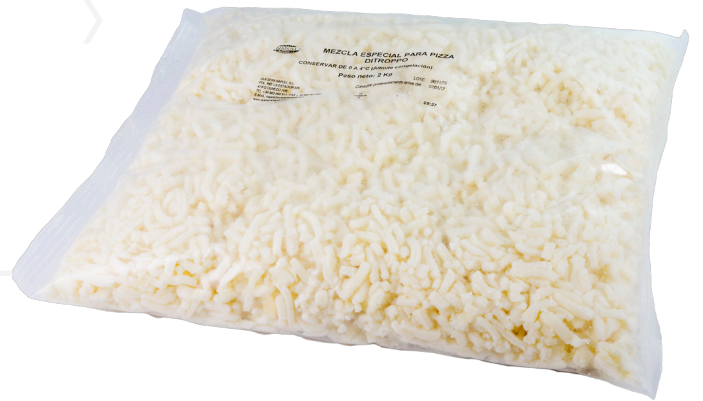
ref.1412 MOZZARELLA 70-30 DITROPPO (2kg. x 6u.)