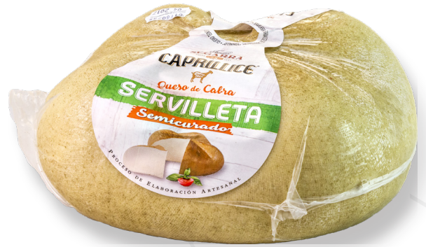
ref.1150 CABRA SEMI SERVILLETA CAPRILLICE (2,5kg. x 2u.)