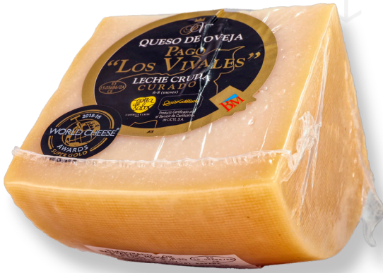
ref.1007,2 OVELLA ETIQUETA NEGRA 1/4 PAGO LOS VIVALES (800gr. x 8u.)