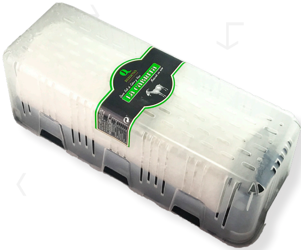
ref.1146 RULO CABRA 100% LA CABRITA (1kg. x 1u.)