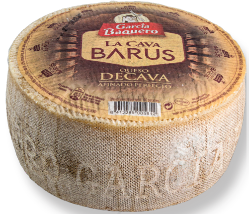
ref.1042 LA CAVA BARUS GARCIA BAQUERO (2kg. x 2u.)