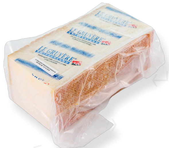
ref.1260 GRUYÈRE SUIS AOC (2,5kg. x 6u.)