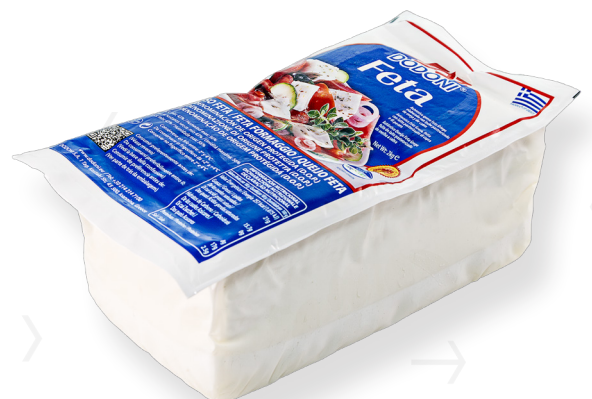
ref.1144 FETA DODONI (2kg. x 3u.)