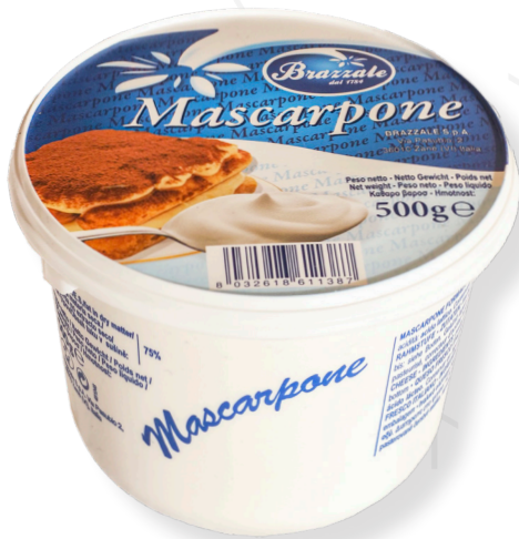
ref.1555 MASCARPONE BRAZZALE (500gr. x 6u.)