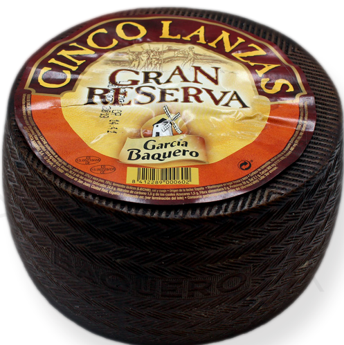
ref.1005 OVELLA GRAN RESERVA CINCO LANZAS GARCIA BAQUERO (3kg. x 2u.)