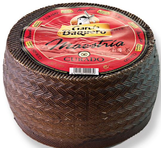
ref.1026 MAESTRIA CURAT GARCIA BAQUERO (3kg. x 2u.)