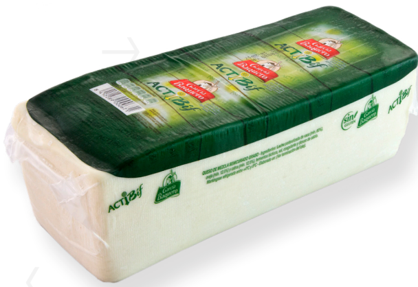
ref.1077 BARRA ACTIBIF GARCIA BAQUERO (2,8 kg. x 2u.)