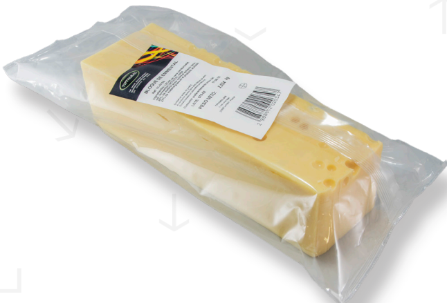
ref.1248 BLOC EMMENTAL 10 X 10 TIPPAGRAL (2,5kg. x 4u.)