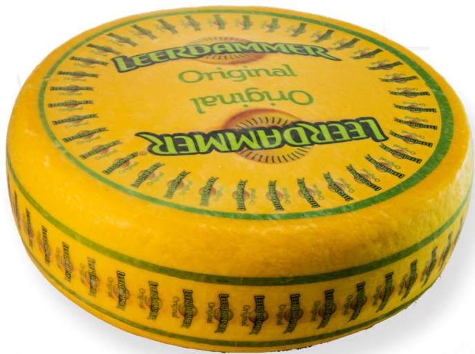
ref.1226 LEERDAMMER ORIGINAL (12kg. x 1u.)