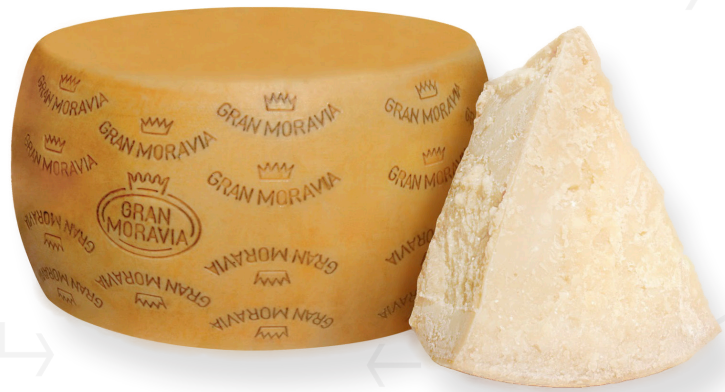
ref.1276 GRAN MORAVIA EXTRA CURAT 1/2 BRAZZALE (18kg. x 2u.)