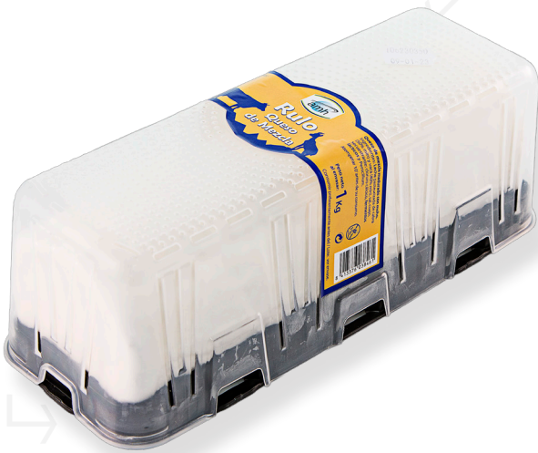
ref.1147 RULO MESCLA 50-50 AMH (1kg. x 1u.)