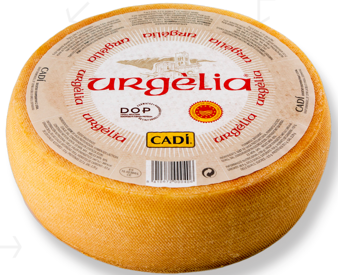
ref.1078 URGELIA D.O.P. CADI (2,5kg. x 2u.)