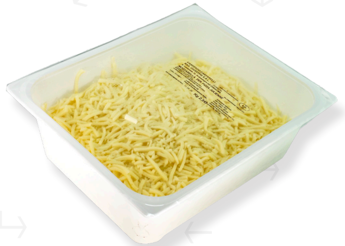
ref.1382 MOZZARELLA PETINICCHIO (1kg. x 10u.)