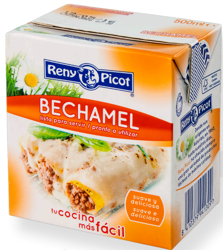
ref.1500 BETXAMEL RENY PICOT (500cc. x 6u.)