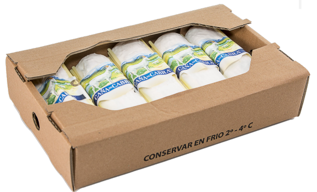
ref.1149 MINI CABRA 100% BLANSON D'OR (180gr. x 6u.)