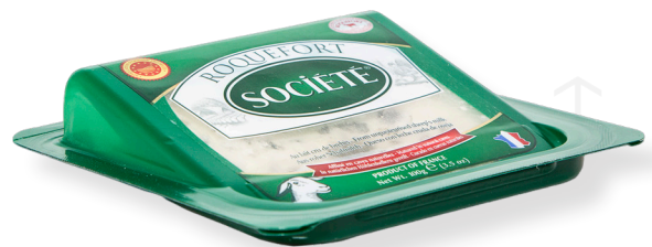
ref.1630 ROQUEFORT SOCIETE (100gr. x 10u.)