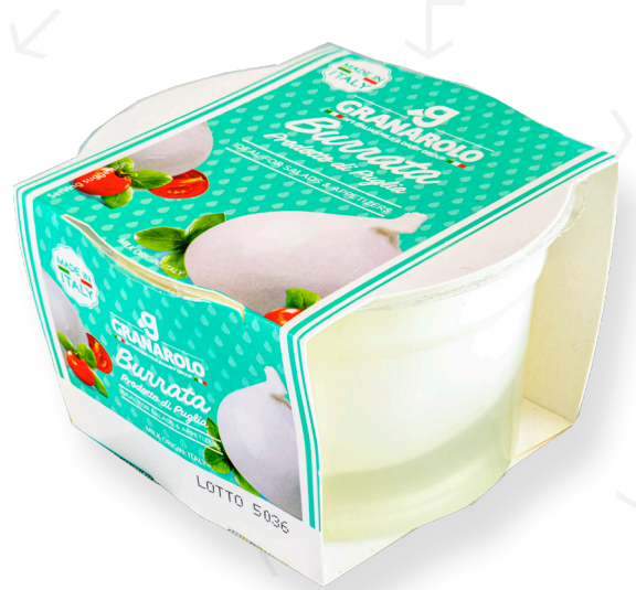
ref.1410,5 BURRATA GRANAROLO (125gr. x 8u.)x 10u.