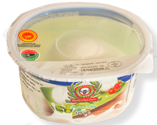
ref.1585 MOZZARELLA DI BUFALA TREE STELLE (125gr.. x 12u.)