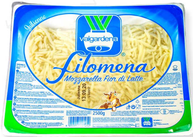
ref.1402,4 MOZZARELLE JULIENNE GIUSEPPE (2,5kg. x 4u.)