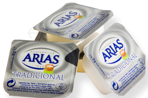
ref.1548 MANTEGA PORCIONES ARIAS (10gr. x 100u.)