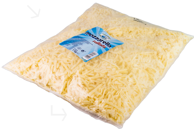
ref.1408 MOZZARELLA 100% RATLLADA AMH (1kg. x 10u.)