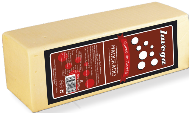
ref.1074 BARRA MESCLA LA VEGA (3kg. x 2u.)