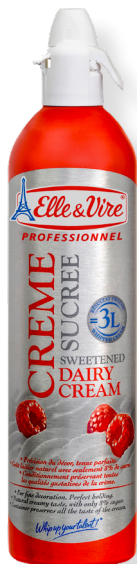
ref.1512 NATA SPRAY ELLE VIRE (700ml. x 6u.)