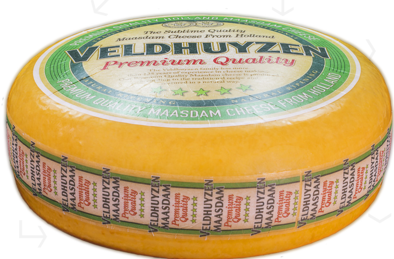
ref.1230 MAASDAM 45% ROYAL ORANGE (13kg. x 1u.)