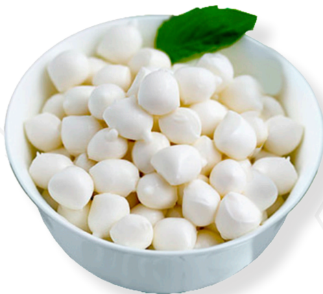
ref.1410,2 PERLES DE BURRATA TREE STELLE (20u. x 50gr. 1kg.)