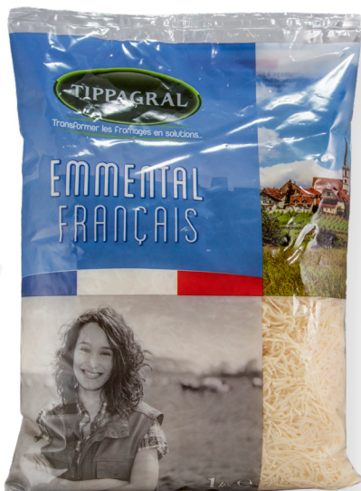
ref.1415,5 EMMENTAL FRANCÈS TIPPAGRAL (1kg. x 10u.)