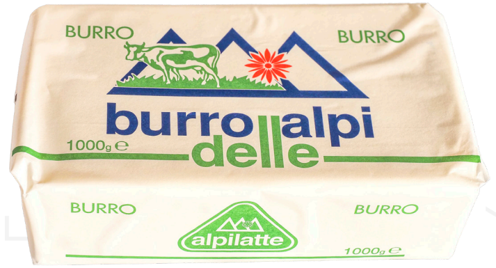
ref.1425 MANTEGA DELLE ALPI (1kg. x 12u.)