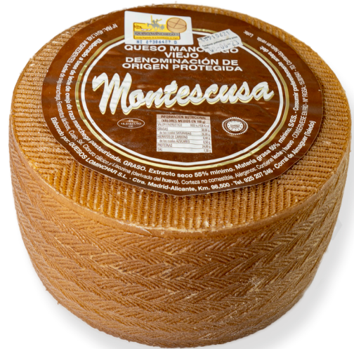
ref.1003,2 OVELLA VELL D.O.LA MANCHA MONTESCUSA (3kg. x 2u.)