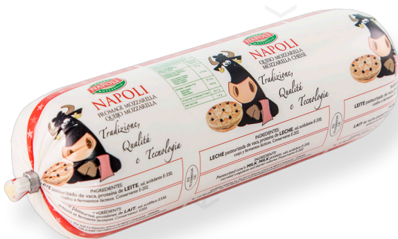
ref.1405 MOZZARELLA EN RULO NAPOLI (1kg. x 12u.)