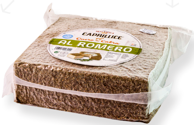
ref.1006 CABRA SEMI AL ROMER CAPRILLICE (2,5kg. x 1u.)