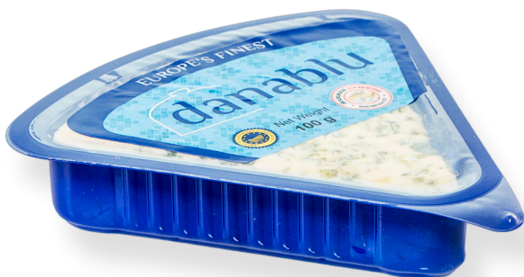
ref.1635 BLAU DANES DANABLU (100gr. x 10u.)