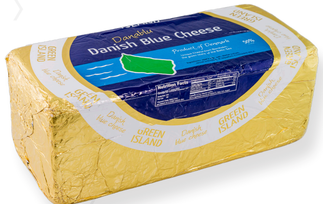
ref.1305 BARRA BLAU DANES 50% DREEN ISLAND (3,5kg. x 1u.)