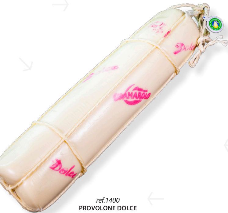
ref.1400 PROVOLONE DOLCE GRANAROLO (5kg. x 1u.)