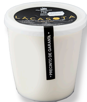
ref.1014,6 CREMA DE "MANCHEGO" CURAT VELL LA CASOTA (1kg. x 4u.)