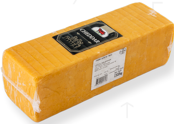
ref.1189 CHEDDAR 50% PALADIN (3kg. x 3u.)