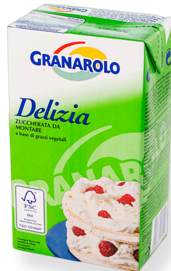
ref.1436 NATA VEGETAL ENSUCRADA DELIZIA (1L. x 12u.)