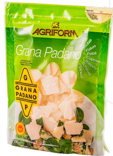
ref.1418 PETALS DE GRANA PADANO AGRIFORM (100gr. x 20u.)