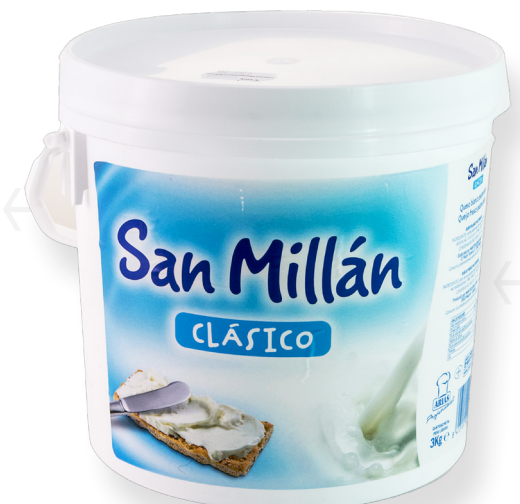
ref.1151 CREMA SAN MILLAN ARIAS (3kg. x 2u.)