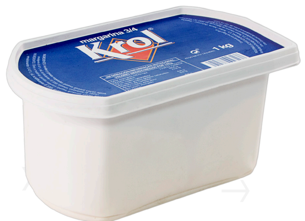
ref.1432 MARGARINA VEGETAL KROL (1kg. x 6u.)