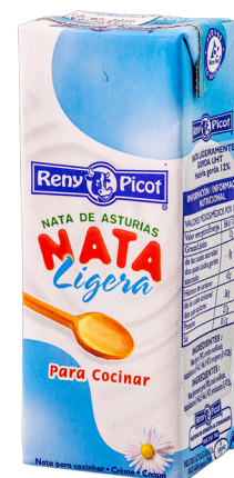
ref.1510 NATA CUINA RENY PICOT (20cl. x 12u.)