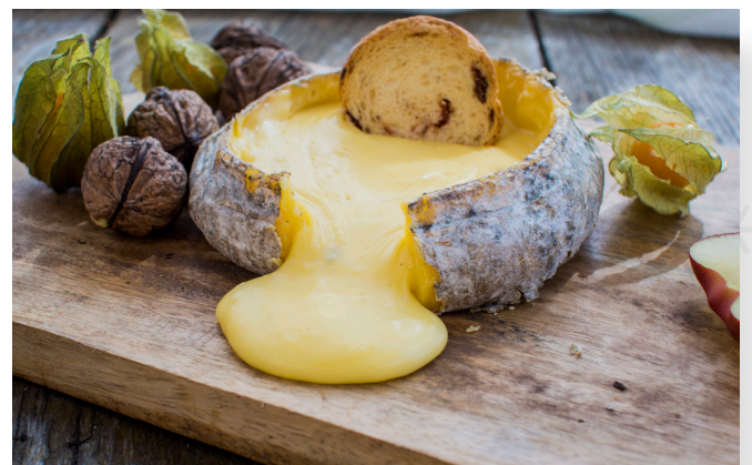
ref.1322 - 1323 FORMATGE TERRA PASTA BLANA AIRAS MONIZ (1kg. i 300gr.)