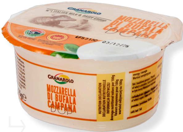
ref.1585 MOZZARELLA BUFALA D.O.P. GRANOROLO (125gr x 6u.)