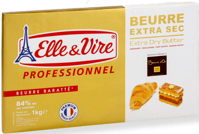
ref.1422 MANTEGA EXTRA SECA 84% ELLE VIRE (1kg. x 10u.)