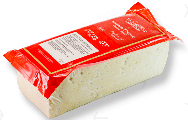
ref.1375 HAVARTI 60% DANÉS ST CLEMENS (4kg. x 1u.)