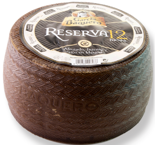
ref.1025 RESERVA 12 MESOS GARCIA BAQUERO (3kg. x 2u.)