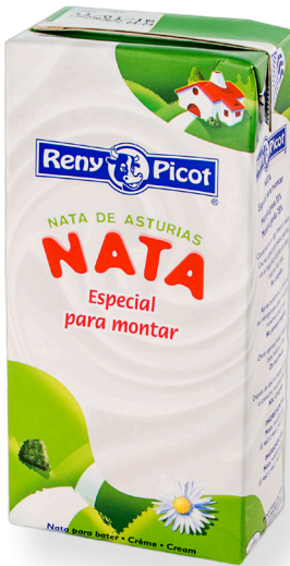
ref.1435 NATA UTH MUNTAR 35% RENY PICOT (1L. x 6u.)