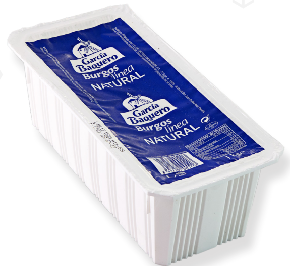
ref.1140,6 BURGOS LINEA GARCIA BAQUERO (1kg. x 2u.)