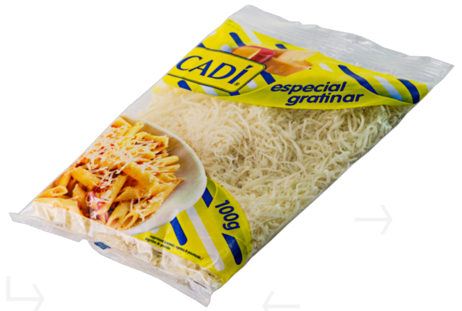
ref.1610 RATLLAT CADI (100gr. x 12u.)