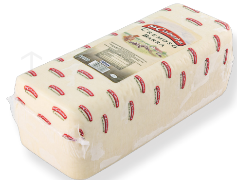
ref.1155 LA CABAÑA ARIAS 3kg. x 3u.)