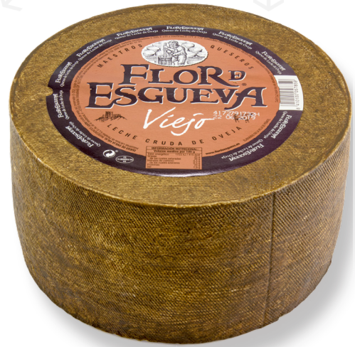
ref.1016 OVELLA PUR VELL FLOR DE ESGUEVA (3kg. x 2u.)