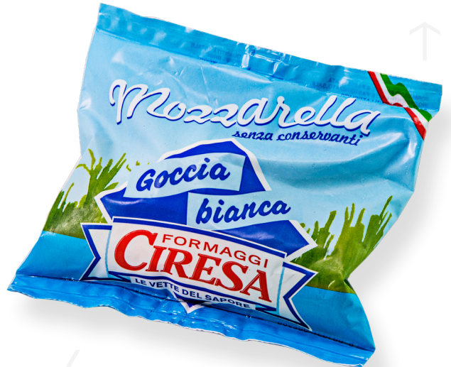
ref.1586 MOZZARELLA FRESCA DE VACA CIRESA (125gr. x 12u.)