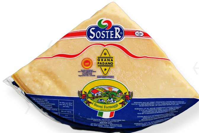
ref.1280 GRANA PADANO +12M D.O.P. SOSTER (4,5kg. x 4u.)