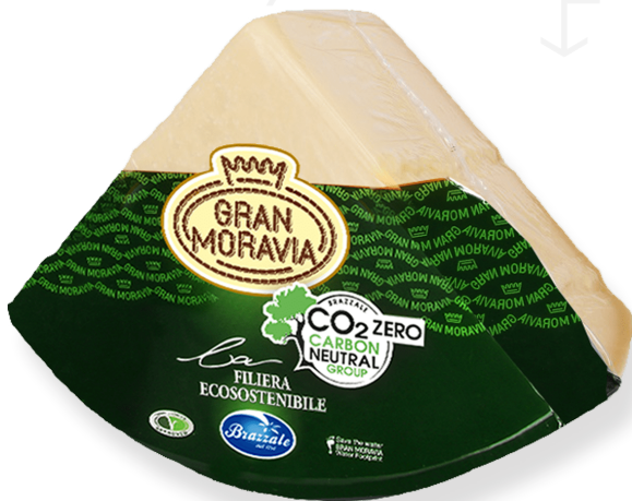
ref.1276,2 GRAN MORAVIA EXTRA CURAT 1/8 BRAZZALE (4,5kg. x 2u.)