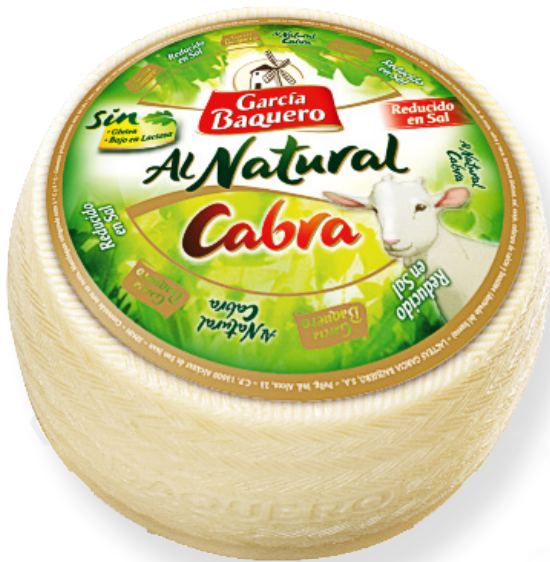
ref.1123 CABRA NATURAL (AL BUIT) GARCIA BAQUERO (3kg. x 2u.)