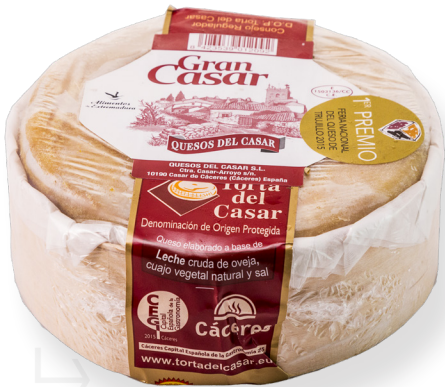
ref.1013,4 MINI TORTA GRAN CASAR TORTA DEL CASAR (350g. x 7u.)