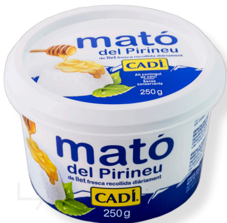
ref.1498 MATÓ DEL PIRINEU CADI (250gr x 8u.)