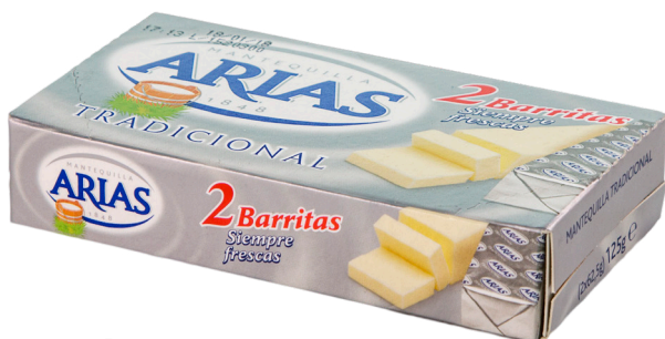
ref.1530 MANTEGA SENCE SAL ARIAS (125gr. x 8u.)