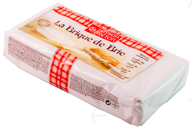
ref.1365 LA BRIQUE DE BRIE PAYSAN DE BRETON (0,9kg. x 3u.)