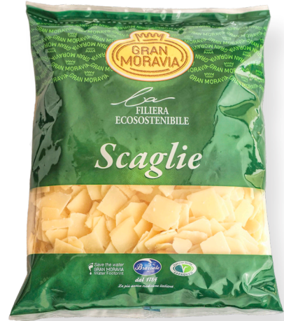
ref.1419 PETALS GRAN MORAVIA (1kg. x 10u.)