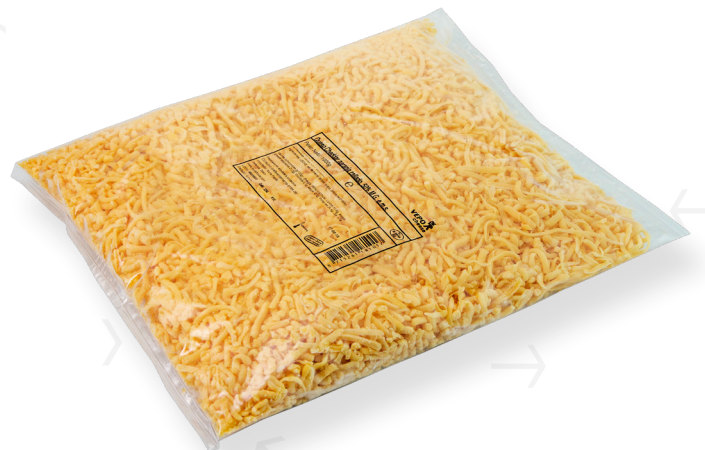
ref.1417 RATLLAT CHEDDAR TIPPAGRAL (1kg. x 10u.)