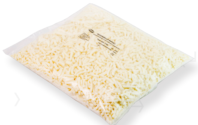
ref.1406 MOZZARELLA RATLLADA NAPOLI (2kg. x 6u.)