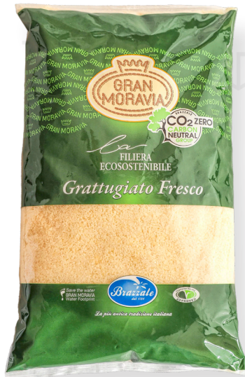
ref.1416 RATLLAT GRAN MORAVIA(1kg. x 10u.)