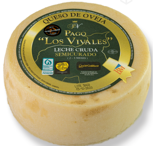
ref.1009 OVELLA LLET CRUA SEMI PAGO LOS VIVALES (3,4kg. x 2u.)