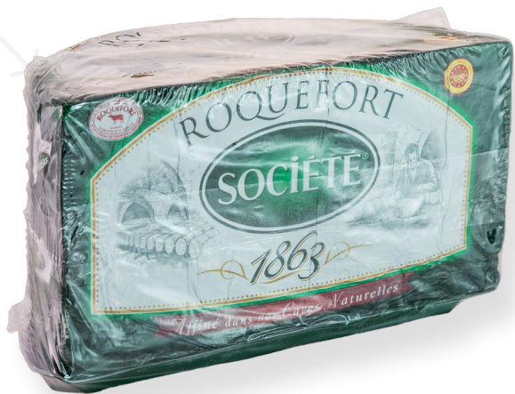
ref.1290 ROQUEFORT 1/2 SOCIETTE (1,3kg. x 2u.)