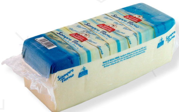
ref.1094 FORMATGE TENDRE GARCIA BAQUERO (3kg. x 6u.)