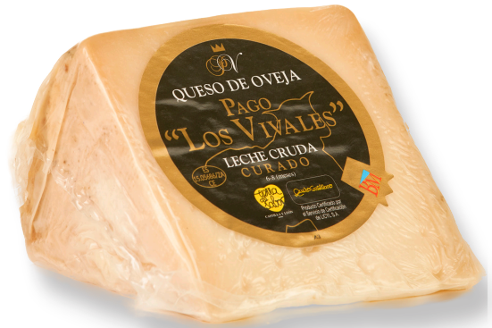
ref.1007,4 OVELLA ETIQUETA NEGRA 1/8 PAGO LOS VIVALES (400gr. x 16u.)