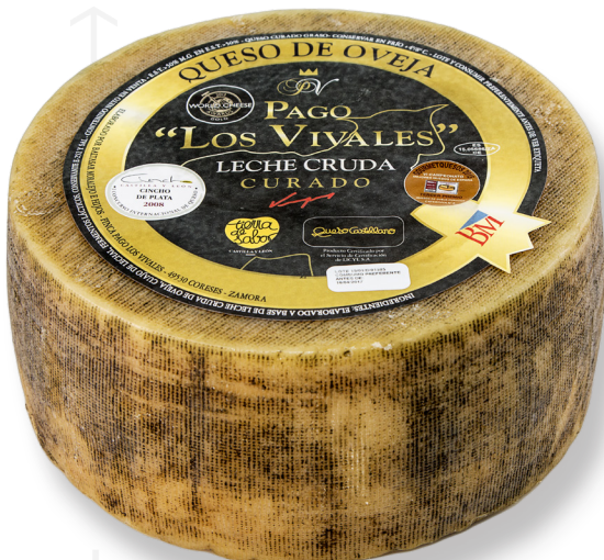
ref.1007 OVELLA CURAT, ETIQUETA NEGRA PAGO LOS VIVALES (3,2kg. x 2u.)