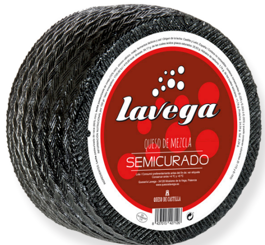
ref.1053 SEMICURAT MESCLA LA VEGA (3kg. x 2u.)