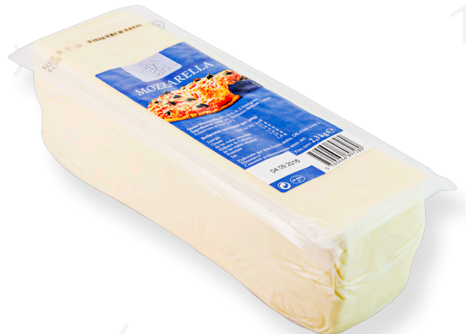
ref.1260 MOZZARELLA DANESA LADY BIRD (2,3kg. x 8u.)