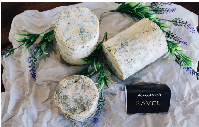
ref.1295 FORMATGE BLAU SAVEL AIRAS MONIZ (1kg. x 4u.)