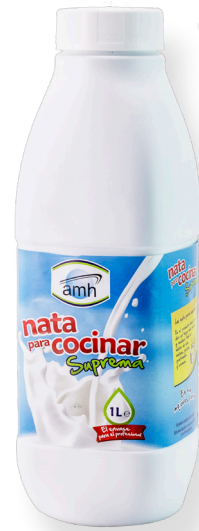
ref.1439 NATA CUINA SUPREMA 20% AMH (1L. x 10u.)