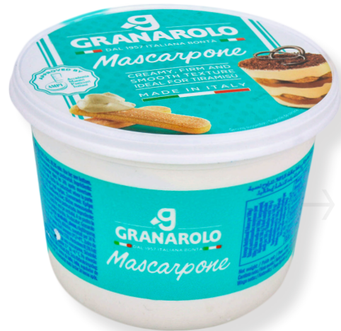
ref.1556 MASCARPONE GRANAROLO (500gr. x 6u.)