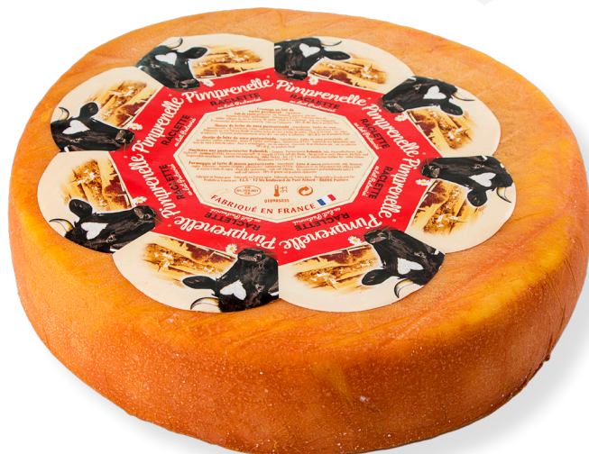
ref.1275 RACLETTE FRANCESA GLAC (5kg. x 1u.)