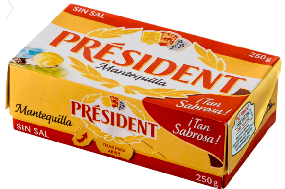
ref.1540 MANTEGA SENSE SAL PRESIDENT (250gr. x 20u.)