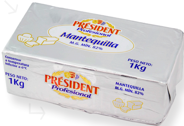
ref.1430 MANTEGA BLOC PRESIDENT (1kg. x 10u.)