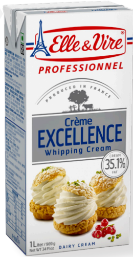
ref.1442 NATA CUINA EXCELLENCE 35,1% ELLE VIRE (1L. x 6u.)